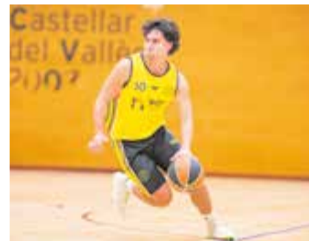
El CB Castellar és penúltim de la taula.

Segona derrota consecutiva en Lliga del CB Castellar, que va caure per 58 a 70 contra el CN Terrassa, equip que encara no coneixia la victòria aquesta temporada.