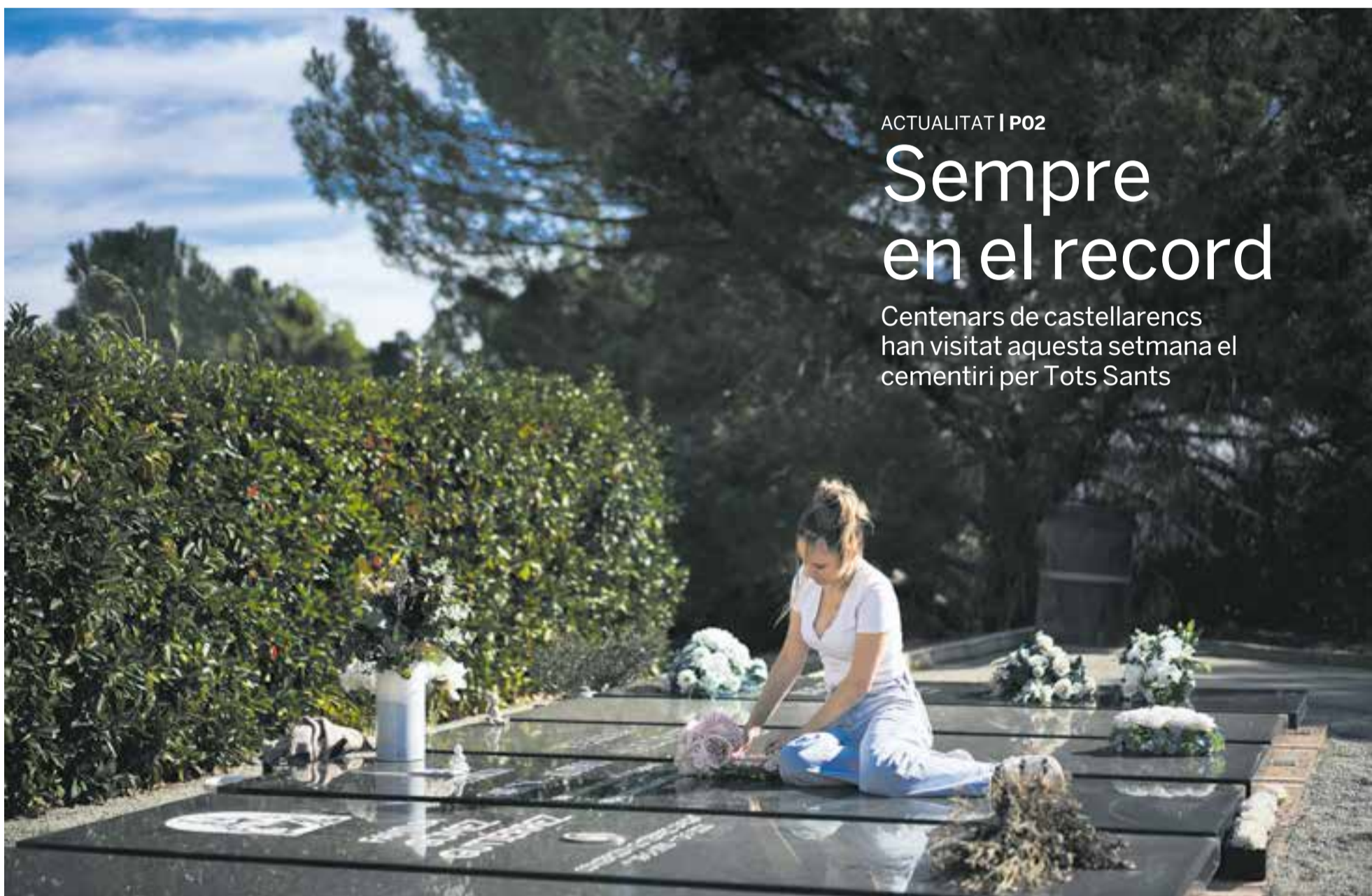
Una veïna de Castellar arregla la tomba dels seus avis al cementiri municipal a principis d'aquesta setmana, coincidint amb Tots Sants.

Centenars de castellarencs han visitat aquesta setmana el cementiri per Tots Sants