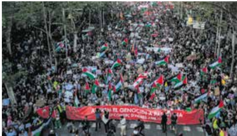
Manifestació de suport a Palestina a Barcelona, dissabte 21 d'octubre. || A. ADNAN

El 7 d'octubre guerrillers de Hamas van protagonitzar un atac sorpresa coordinat contra Israel. Com a resposta, l'endemà l'exèrcit israelià va iniciar atacs de represàlia a la franja