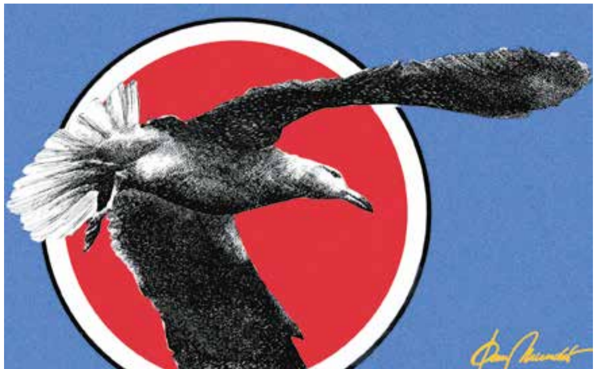
© 'Joan Salvador Gavina'.