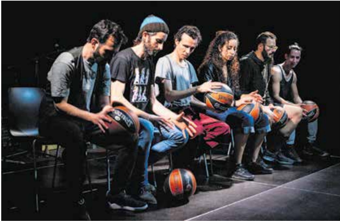
L'Orquestra Basket Beat presenta 'Bots pel canvi' a l'Auditori Municipal, dissabte dia 4.

Dissabte, l'Orquestra Basket Beat presenta 'Bots pel canvi'; diumenge, Inspira Teatre portarà 'Sotabosc'