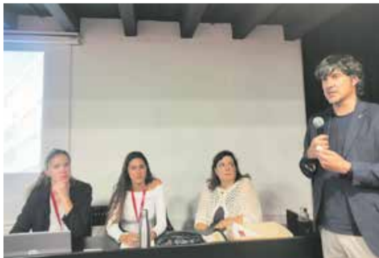
El regidor d'Urbanisme va obrir la sessió informativa.

Durant la sessió també es van donar dades sobre el nombre d'edificis de més de 8 habitatges de Castellar del Vallès que estan obligats a passar la inspecció tècnica d'edificis (ITE). Es tracta d'un sistema de con-