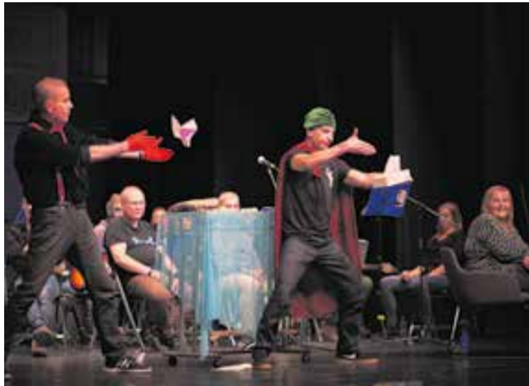
Una de les actuacions que va incloure el festival SOM Salut Mental.

Els protagonistes de les diferents actuacions van ser la coral Pas a Pas, el grup Arc de Sant Martí, el grup musical Krek'n'tu de Salut Men-