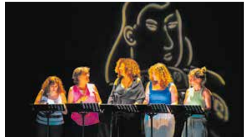
Les actrius de 'Judici a un seductor' de T.I.C. Escènic.

Éric-Emmanuel Schmitt (Sainte-Foy-lès-Lyon, 1960) és filòsof, escriptor, cineasta i dramaturg francès, de nacionalitat belga. És l'autor, entre d'altres, d' El visitant . + || M. A.