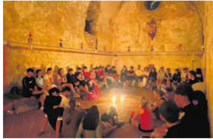
Els alumnes de 4t d'ESO van fer una trobada al Puig de la Creu. || I.E. SANT ESTEVE