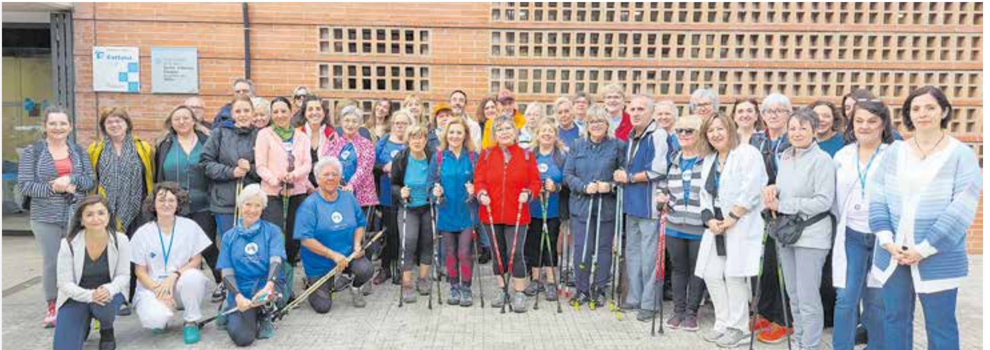
Els especialistes socio-sanitaris van poder veure una demostració 'in situ' de l'activitat de la marxa nòrdica. || A. J. CASTELLAR