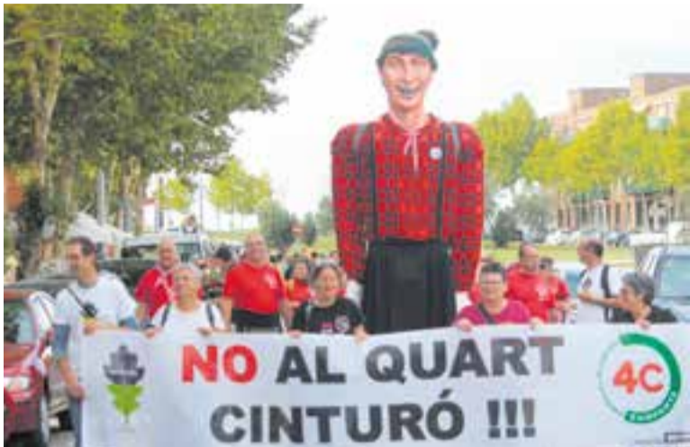
La cercavila de cultura popular de diumenge al matí.