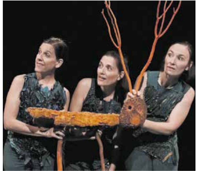
Les tres intèrprets de 'Sotabosc', que es veurà diumenge de dues sessions.