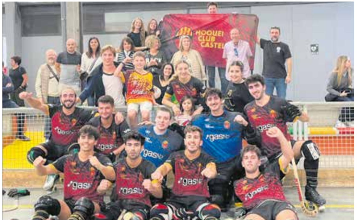
Els granes van poder celebrar la primera victòria com a visitant al pavelló del CPI Espanyol.

El calendari per a les properes cinc setmanes els és molt propici, ja que jugaran quatre partits a casa dels cinc que han de disputar. Després de rebre el Congrés, l'equip visitarà la pista de la UE Horta i posteriorment tindrà tres jornades consecutives a casa contra el CP Belllloc, el CP Monjos i el PHC Sant Cugat. Un bon moment per confirmar el Pedrosa com el fortí que fins ara està sent per a l'equip. +