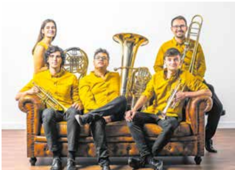
KamBrass Quintet oferirà un concert dijous 9, a l'Auditori Municipal.

Les Audicions Íntimes de L'Aula són obertes a tota la ciutadania. Cal destacar que les entrades d'aquesta temporada tenen un preu més econòmic a partir d'ara, de 5 euros per als socis i 10 euros per als no socis. +