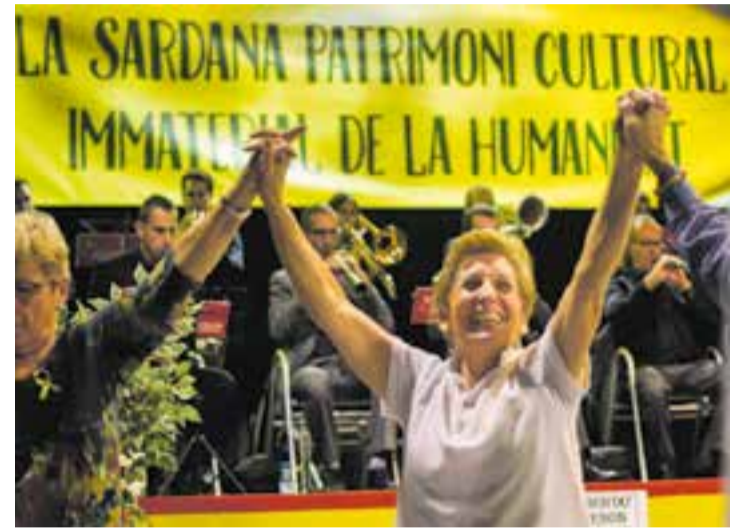
Una de les anteriors ballades de l'ASAC, a Castellar del Vallès.

L'Agrupació Sardanista Amics de Castellar (ASAC) celebra la 47a Diada Sardanista el dissabte 4, a partir de les 17.30 hores, amb les cobles Jovenívola de Sabadell i Sant Jordi - Ciutat de Barcelona. L'acte tindrà lloc a la Sala Blava de l'Espai Tolrà.