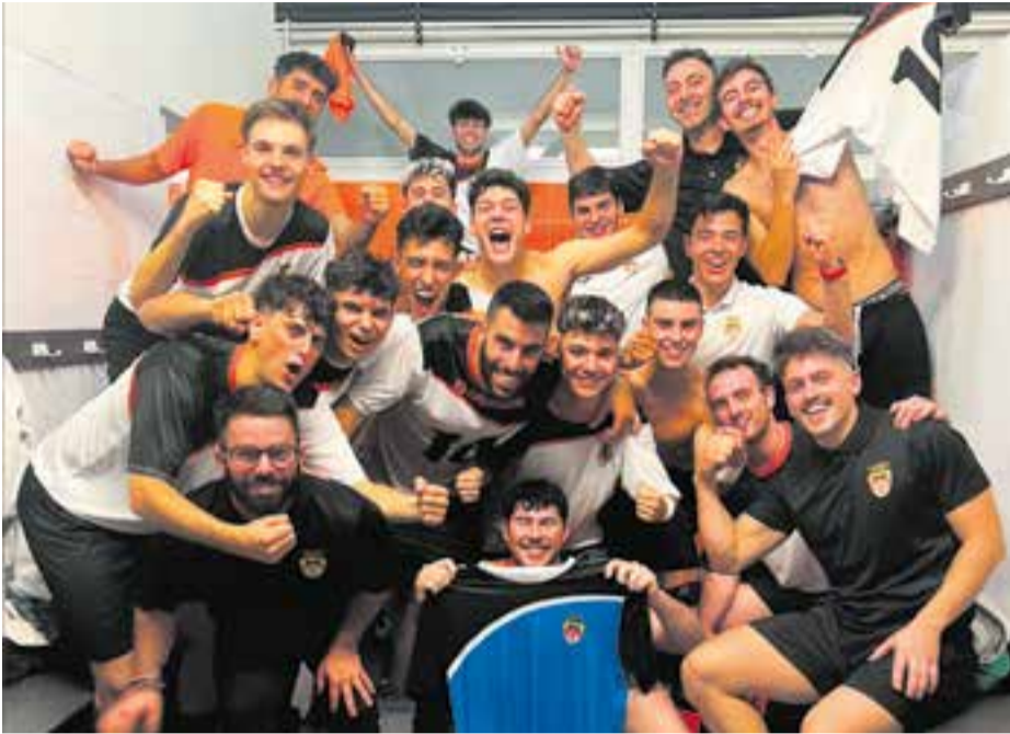
Els taronges comencen a acumular experiència a Tercera Divisió i comencen a ser respectats.