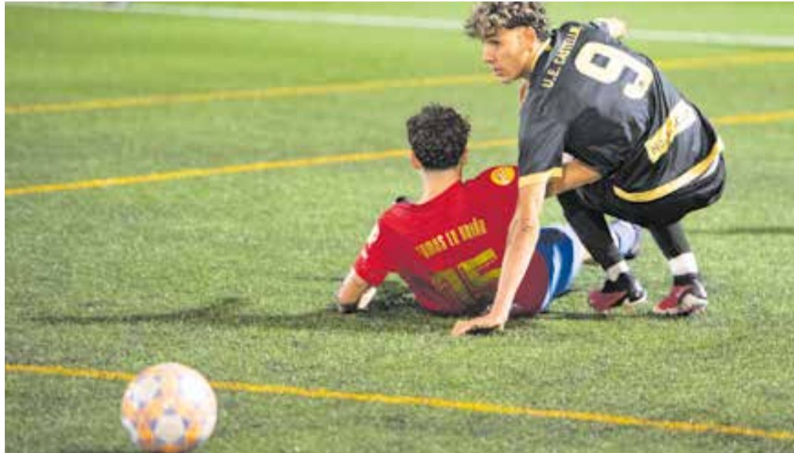
Tot i mostrar un bon futbol, la falta d'encert de cara a porteria va tornar a fer caure el Castellar.