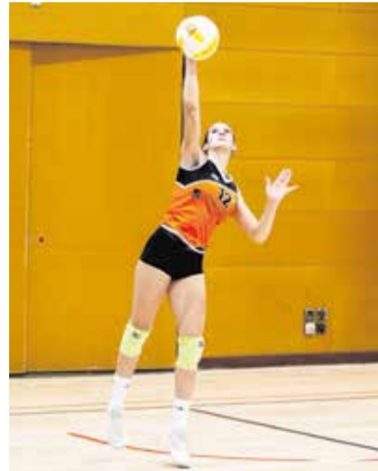
El femení va caure contra l'Arenys.

Aquesta temporada encara no hi ha hagut una jornada en què els dos equips sèniors de l'FS Castellar hagin aconseguit la victòria en un mateix cap de setmana. En l'última jornada, el femení no va poder arrodonir la festa de la victòria del masculí i va caure per 3-0 contra un dels rivals més complicats de la categoria.