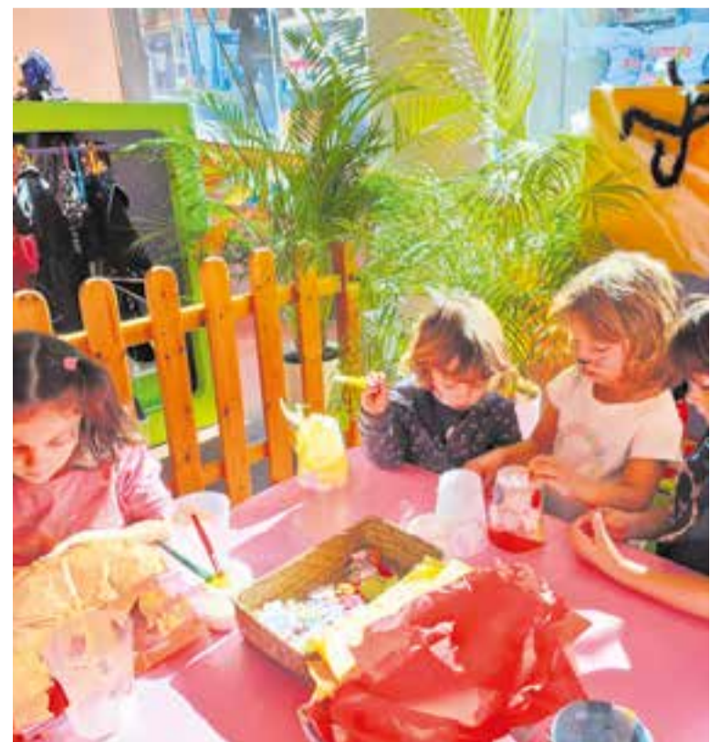
Infants en el taller de pintacares de la ludoteca mòbil La Xerranca.

Per cada 20 euros de compra, el client té dret a un tiquet per al tast. S'han previst unes 800 racions de botifarra per al tast de l'11 de novembre. +