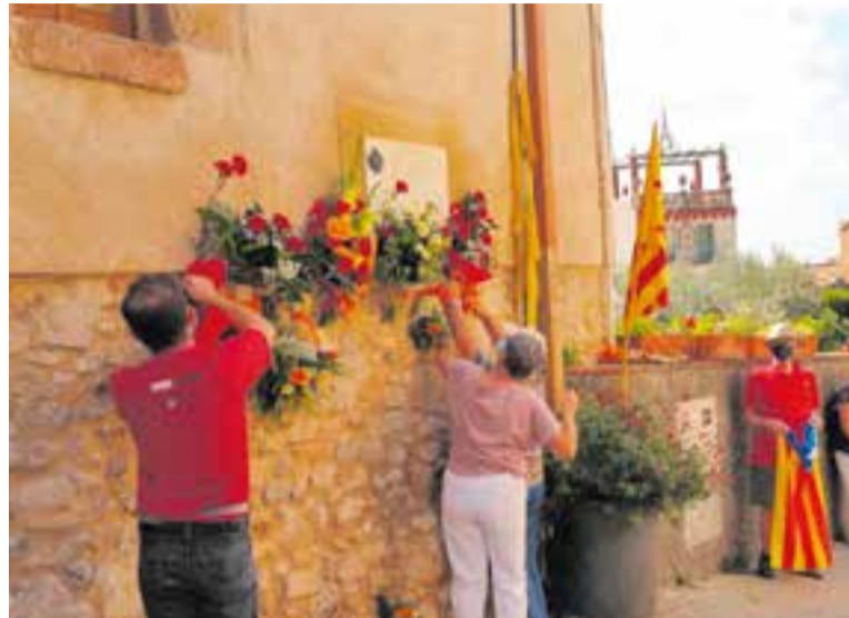
Un moment de l'ofrena floral al carrer de les Roques l'any passat.

A partir de les 11 hores, tindrà lloc l'acte institucional amb motiu de la Diada Nacional de Catalunya al peu de la senyera de la plaça Catalunya. La senyera que presideix la plaça, de 2 x 3 metres, es va erigir fa nou anys coincidint amb la Diada i oneja a nou metres d'altura des de