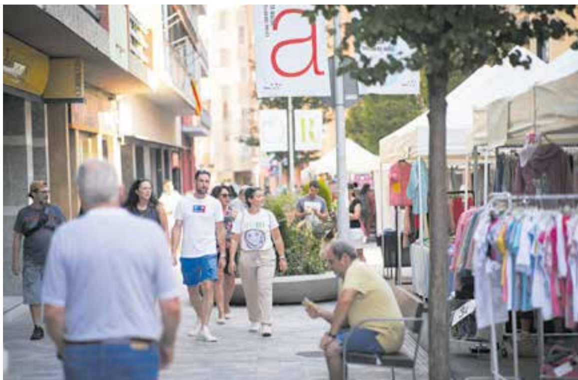
L'Street Market de l'any passat va aplegar nombrosos visitants pels carrers Sala Boadella, Hospital i Montcada. || Q. PASCUAL

Com sempre, hi ha representats els sectors de moda, comple-