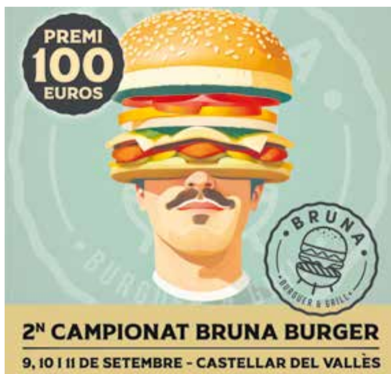
Cartell del Segon Campionat Bruna Burger per Festa Major.

L'objectiu és ser la persona més ràpida en menjar-se una hamburguesa de Bruna Burger Castellar. Concretament, una burger triple Bruna de 100 g amb enciam trocadero, bacó i cheddar. L'any passat, van provar-hi sort una seixantena de participants, creant moments divertits i estampes extravagants. L'èxit de la proposta ha fet que enguany s'organitzi la segona edició, però repartida en tres nits. Així, la nit de dissabte, a partir de les 21 hores, tindrà lloc la primera semifinal, l'endemà, la segona, també a les 21 h. Ambdós dies, el concurs anirà acompanyat d'animació musical amb DJ. La final es disputarà dilluns a les 21.30 hores, dia en què a més de música, hi haurà una exposició de bestiar de la vaca bruna dels