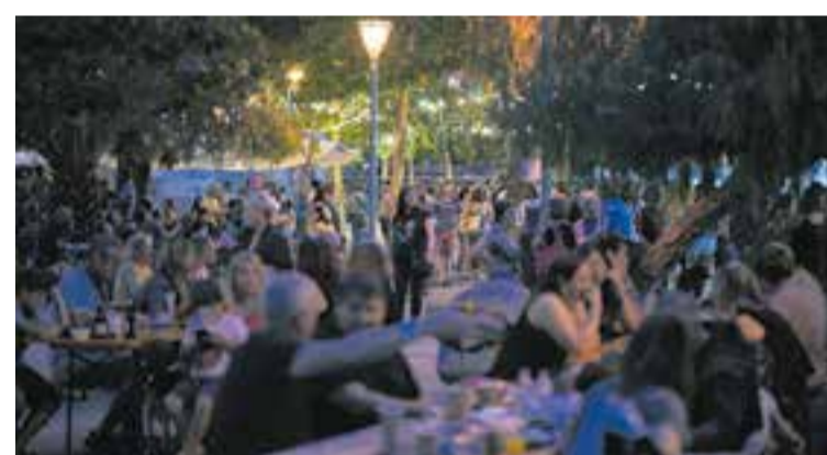
Imatge de la plaça de Catalunya en l'activitat Tast d'Estiu del juliol passat.