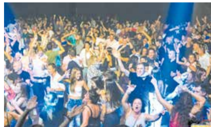
La Festa dels 80 aplega gran quantitat de gent a l'Espai Tolrà.

Hi haurà un creuer pel Mediterrani gentilera d'Àmbar Tours i Costa Cruceros i un sopar per a dues persones a El Brunet. També hi haurà un estand de l'empresa Dsinformal amb marxandatge de l'esdeveniment. →