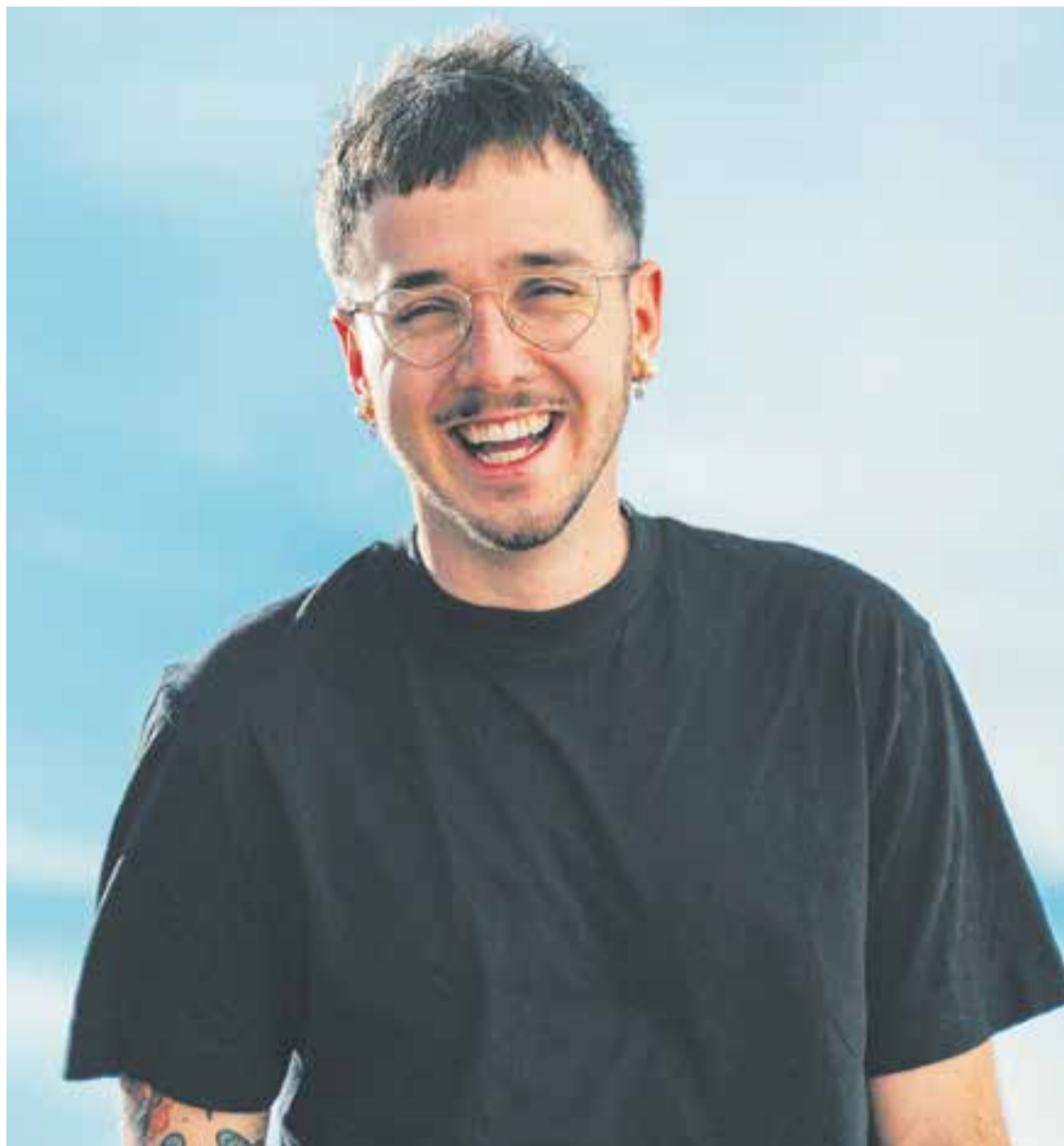
Imatge promocional de Lildami, que presentarà a Vilabarrakes el seu últim disc, 'Dummy'.

Està clar que res del que hauria passat hauria estat igual sense el Chen. No en tinc cap mena de dubte. Quan ens vam conèixer va ser un match instantani. I fa que treballem junts