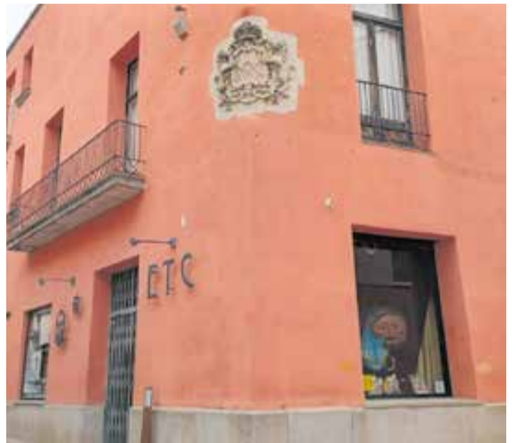
Façana de l'ETC, que celebrarà un vermut de Festa Major el diumenge 10.

Després del dinar, és prevista l'actuació d'un discjòquei perquè l'assistència pugui ballar. ➔