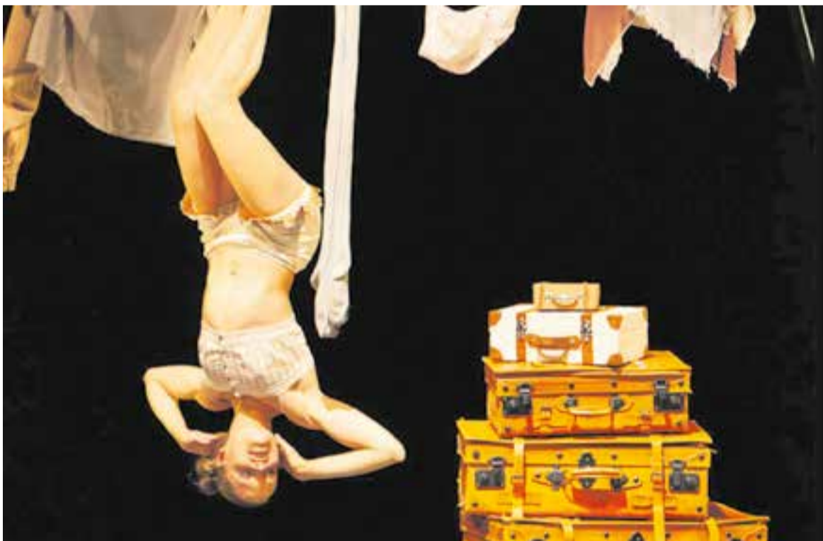
Imatge promocional de l'espectacle 'Els viatges de Bowa'.

Els viatges de Bowa va rebre el premi del públic al festival Mujeres con Narices de les Palmes de Gran Canària el 2021 i el premi del festival Cucha de Otoño, el Premi Kandengue Arts i el Premi Territori Violeta al Festival Circada 2020. ➔