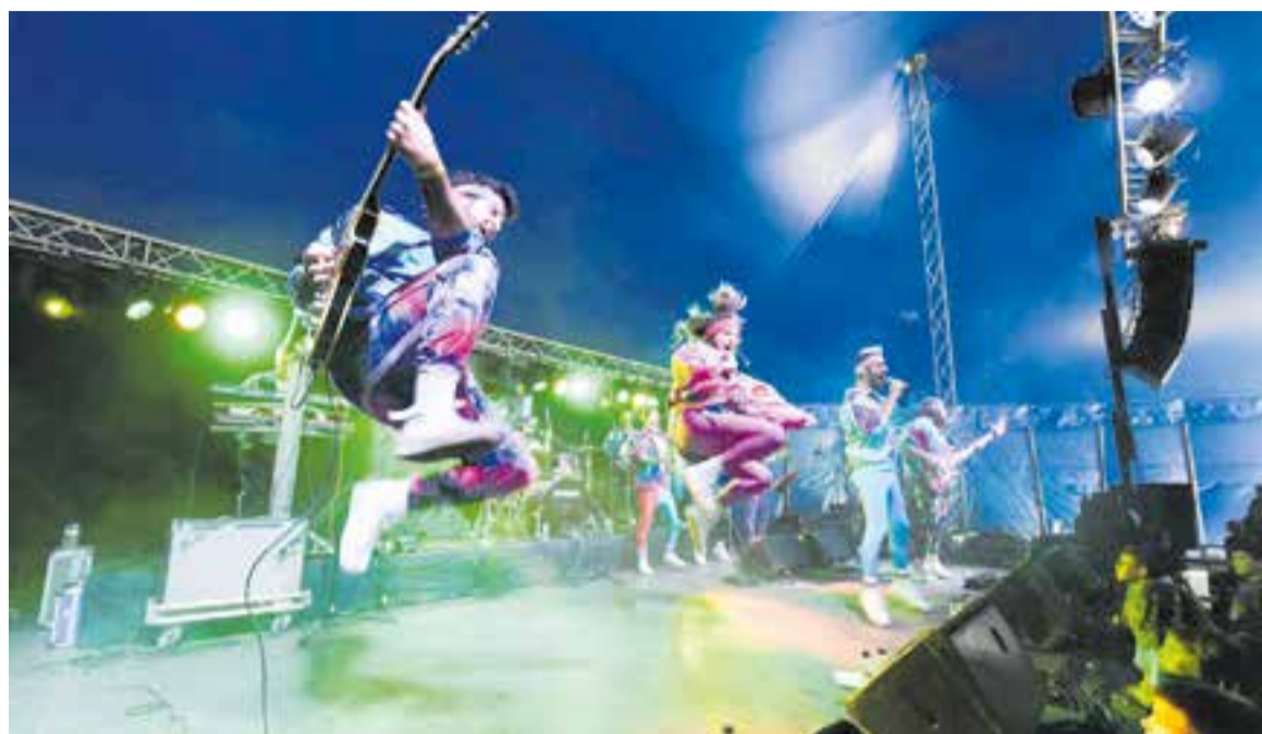
The Txandals passaran per l'escenari de Vilabarrakes dissabte a la nit amb la seva proposta de covers i festa non-stop.