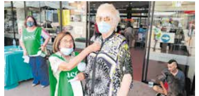
Una foto d'arxiu de la col·lecta que es va realitzar el 2021.

És habitual veure durant aquests dies molts vianants amb el típic adhesiu a la solapa, element que serveix per identificar que s'ha fet el donatiu a la causa. També es poden fer donacions a través de Bizum amb el codi 06097. +