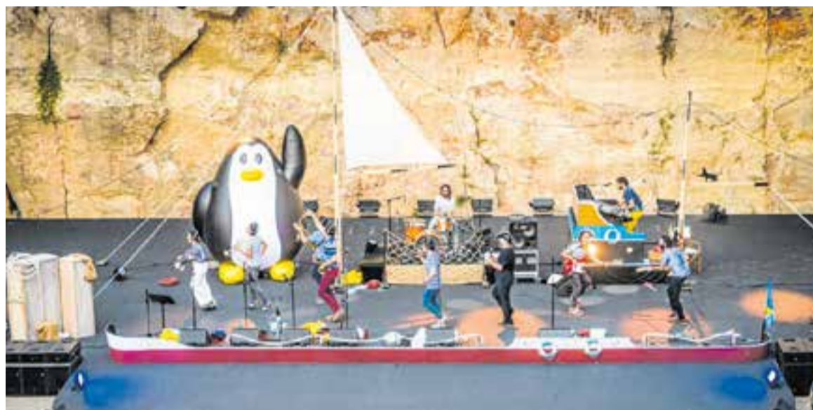
Reggae per Xics presenten 'Quadern de Bitàcola' el dissabte dia 9, per Festa Major, a la plaça de la Fàbrica Nova.

Literalment, és el diari que el capità d'un vaixell escriu quan surt del port cap al seu destí, on va escrivint totes les coses que passen al vaixell durant el dia. Per a nosaltres, és el nom que rep l'últim disc i que vam treure arran de la pandèmia, era una reflexió una mica profunda sobre el tema del confinament i les relacions interpersonals. Vam creure convenient agafar aquest vaixell i transformar les vivències en