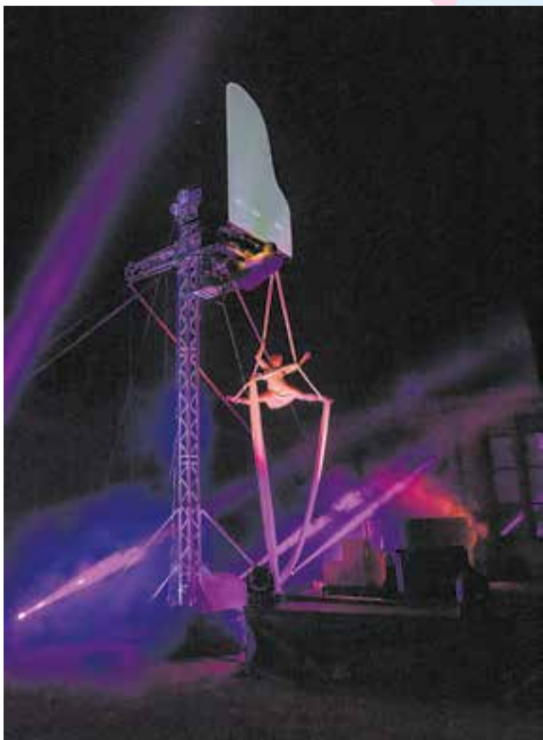
Un moment de l'espectacle de 'Flotados'.

L'espectacle Flotados transforma l'espai urbà en un lloc per somiar, en un univers únic on la música, la dansa i el circ il·luminin els ulls de què el mira. ✦