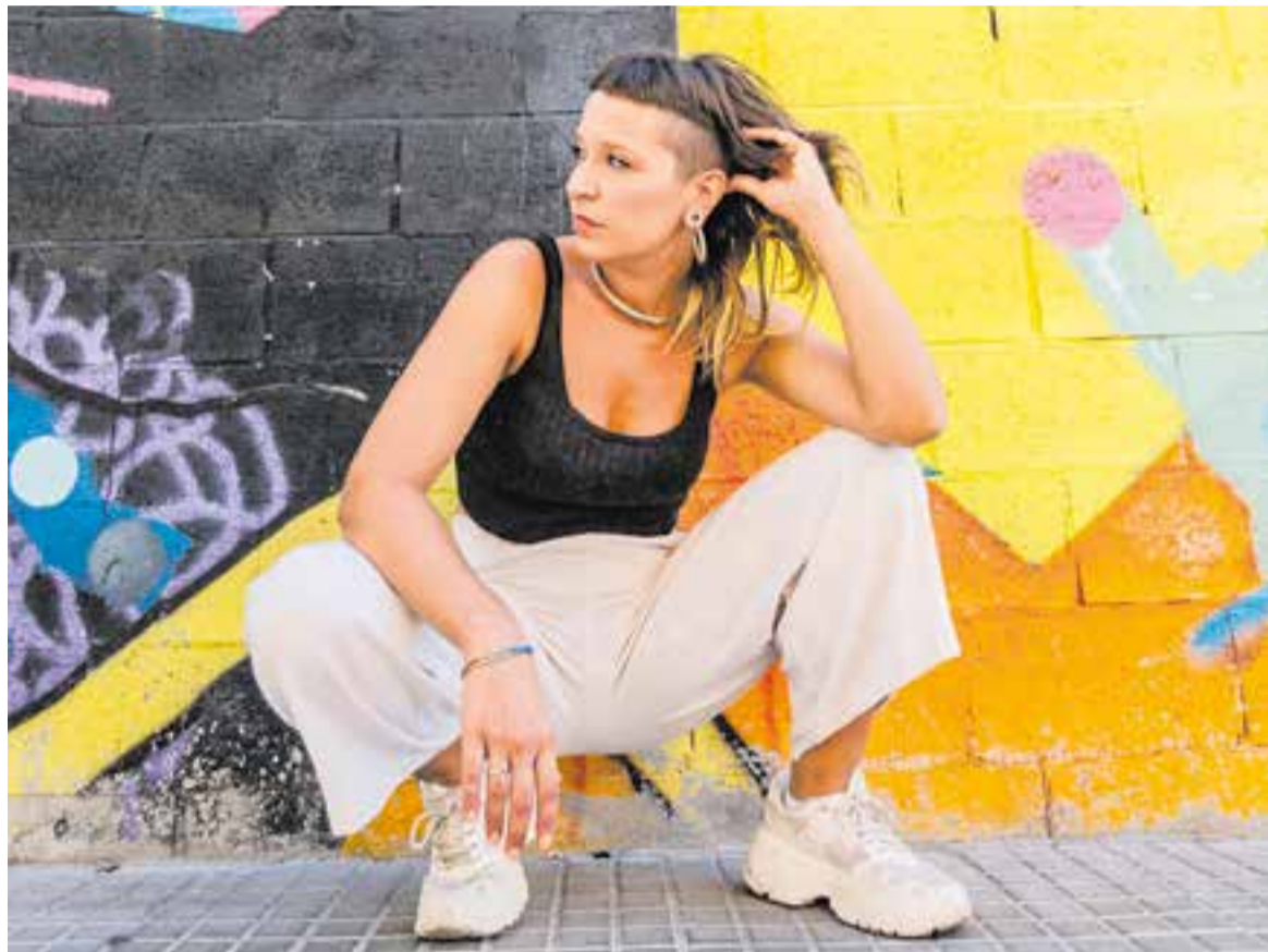
Imatge promocional de Mabel Flores a la gira del seu primer disc d'estudi, 'Meraki'

Aquesta serà la tercera vegada que la cantautora, poeta i educadora social Mabel Flores visita Castellar. L'última vegada va ser en el marc del festival femení i feminista Fem Festival, en l'edició del 2021. És una proposta de música urbana, d'autor, amb ritmes llatins però també hi ressona el pop. Sempre en clau reivindicativa i feminista. “Intento visibilitzar les dones dalt i a baix de l'escenari. Intento que l'equip sigui paritari o que les dones siguin majoria” , explica Mabel Flores. “Des dels escenaris hem de ser molt responsables i ser conscients del poder que tenim com a artistes. M'agrada assenyalar les injustícies i compartir les vivències que he patit com a dona