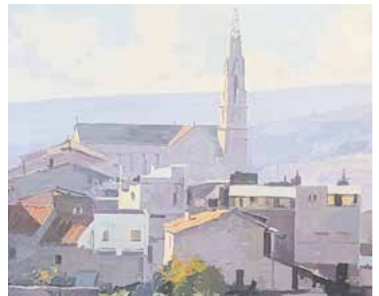
Un dels quadres d'Albert Carnicé que L'Alcavot exposarà els propers dies.

Tot el mes de setembre Exposició d'Albert Carnicé L'Alcavot Espai Cultural Inauguració: dia 2, a les 19 h