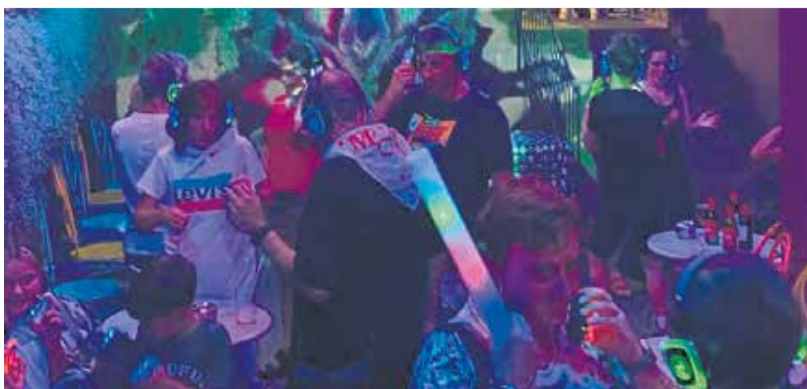
Fins a 100 persones van ballar a la 'silent disco' de l'Andreví Pastissers a la Festa Major del 2022.

L'any passat hi havia una DJ en directe, que punxava per un dels canals i dos canals més amb música variada. La proposta comptava amb 100 auriculars a disposició dels clients que, a estones, van estar tots ocupats. La terrassa de la pastisseria es va convertir en una pista en què cadascú ballava al seu ritme. Una experiència única i divertida. Enguany, hi haurà oportunitat de provar aquesta proposta tres nits consecutives: divendres, dissabte i diumenge. +