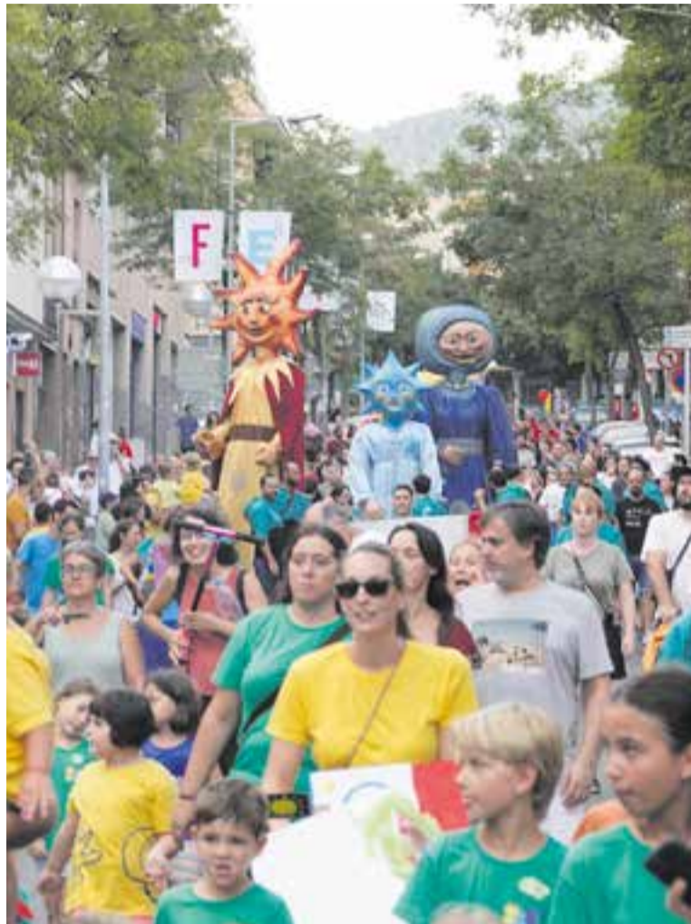
Imatge de la Cercavila Gegantera que té lloc el diumenge de Festa Major. || Q. P.

Com expliquen els organitzadors, el Seguici Popular no és una cercavila. Per tant, es prega al públic que el segueixi des de les voreres i que no s'interposi entre les colles participants. S'ha previst que els balls del seguici tinguin lloc cap a les vuit del vespre, un aperitiu al qual posteriorment serà la invitació a la festa a càrrec de l'espectacle Flotados .