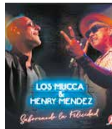
Promoció de la nova cançó.

Tot i que no faltaran cançons pròpies com “Bonita melodía”, que va ser un videoclip d'èxit, o “Niña”, que es va enregistrar a la terrassa d'El Mirador, Los Mucca alterna-