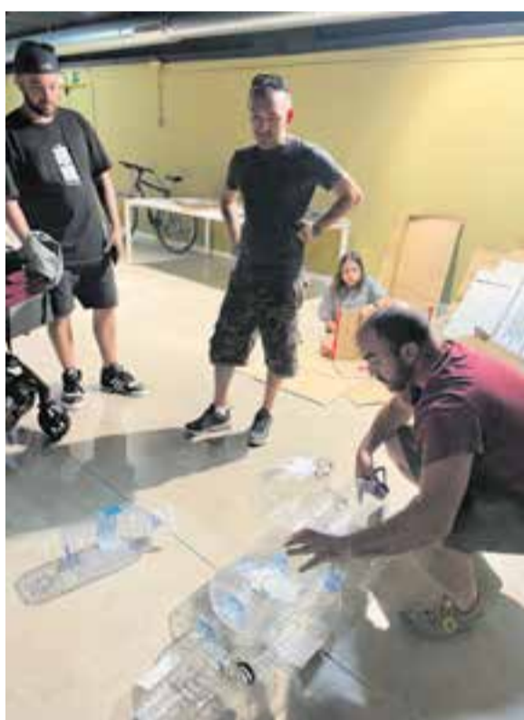
A l'esquerra, els veïns de la Mitja Galta preparant el material, i a la dreta, el veïnat d'El Pujalet elaborant els diferents elements.