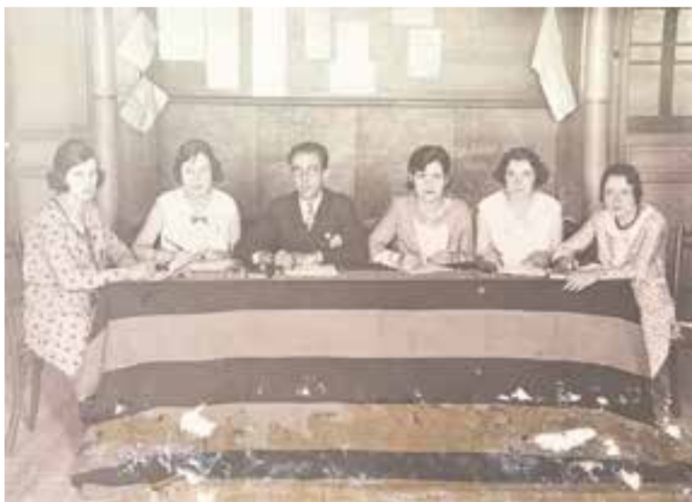
Recollida de signatures per l'Estatut de dones castellarenques, l'any 1931.

Les fotografies formen part del fons de l'Arxiu Municipal i han estat cedides per a ús d'aquesta mostra. La mostra expositiva romandrà oberta al Calissó des del dia 6 de setembre durant els horaris d'obertura de l'establiment, i fins al 5 d'octubre. ➔