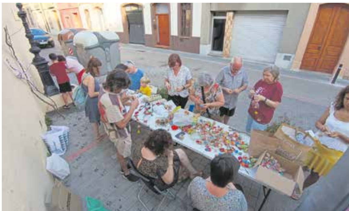
Trobada dels veïns i veïnes de l'Associació Casc Antic per preparar la decoració del carrer del Centre.