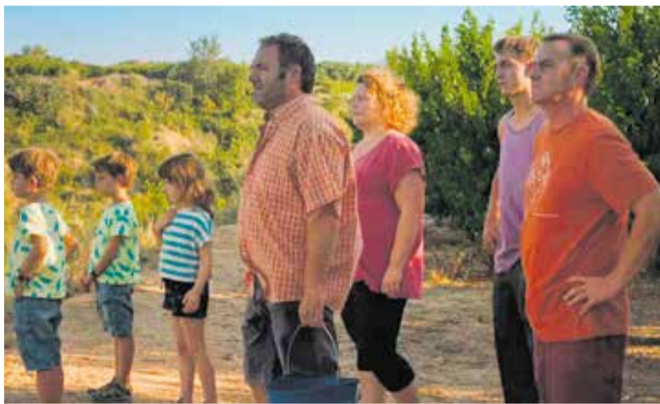
'Alcarràs' va aconseguir atraure 535 espectadors, sumant les dues projeccions programades.

'Alcarràs' de Carla Simón ha estat la pel·lícula més vista, seguida de la cinta 'En los márgenes' de Juan Diego Botto