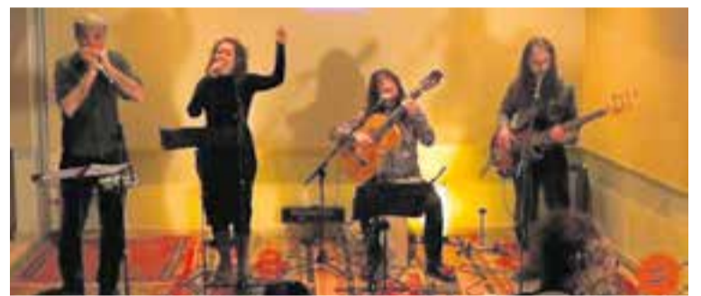
Voleo actua dissabte, a les 19 hores, al Calissó Cultural.