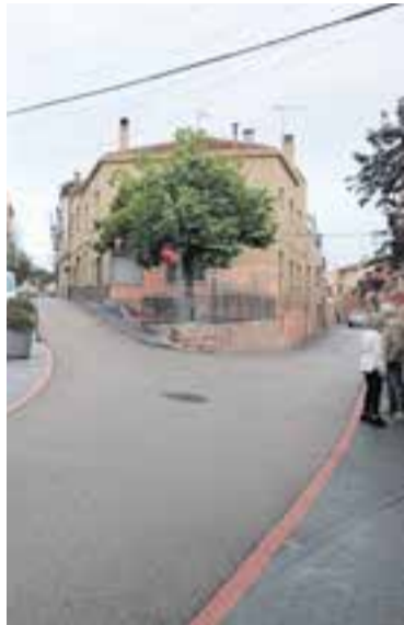
Imatge de la plaça Vella.

Per a aquesta Festa Major s'han previst actes durant tota la tarda organitzats per l'associació i amb la participació de diverses entitats de Castellar, activitats que s'allargaran fins a la 1 de la matinada. A partir de les 17 hores, s'iniciarà una cercavila amb els Gegants de l'Esbart Teatral de Castellar i el grup del Ball de Bastons. A les 18.30 hores és prevista una actuació dels Capgirats i, a les 19 hores,