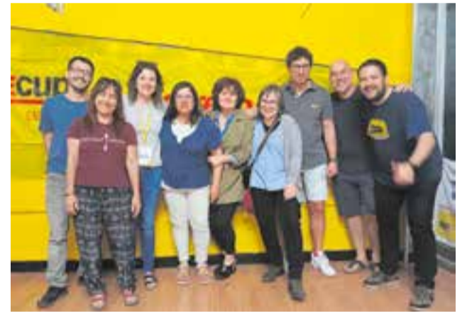
De dalt a baix i d'esquerra a dreta, diversos moments de la nit electoral a Castellar: Som de Castellar-PSC, ERC, Junts, Ara Toca i la CUP, forces que seuran al saló de plens aquest mandat.