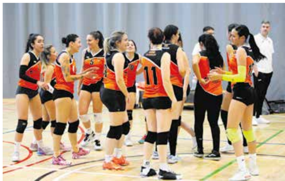
El primer equip femení ha aconseguit l'objectiu de la permanència. || MARC CASALS