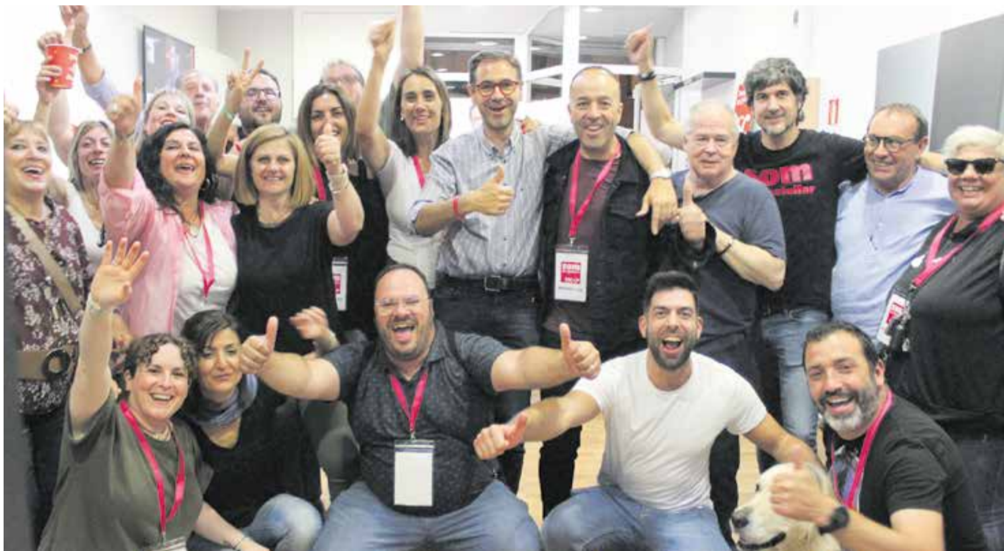
L'equip de Som de Castellar - PSC celebra la victòria electoral diumenge passat a la nit a la seva seu del carrer Barcelona. Es va respirar eufòria en aconseguir la cinquena majoria, quarta consecutiva absoluta.

ERC perd un regidor, Junts en guanya un, la CUP manté el que tenia i Ara Toca entra al ple amb un representant