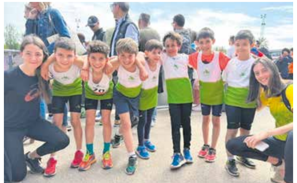
L'equip sub10 del CA Castellar en el campionat de Catalunya per equips al Prat de Llobregat.