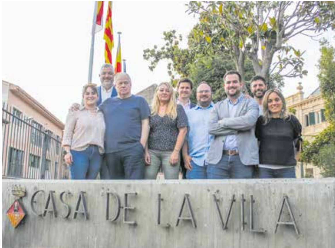
Al final del ple, les regidores i regidors que pleguen es van fer una foto de família a la rampa que dona accés al Palau Toirà.

Per part d'ERC han estat tres membres del grup municipal que