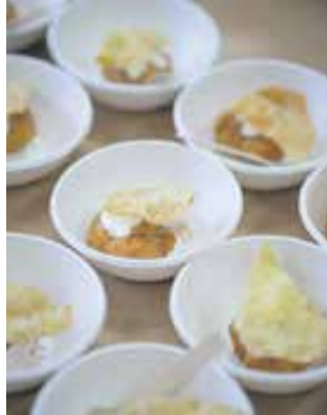
Una tapa de l'edició anterior. || Q. P.

La iniciativa aquest any també premiarà la participació de la ciutadania, així com l'adhesió dels establiments participants, a través de con-