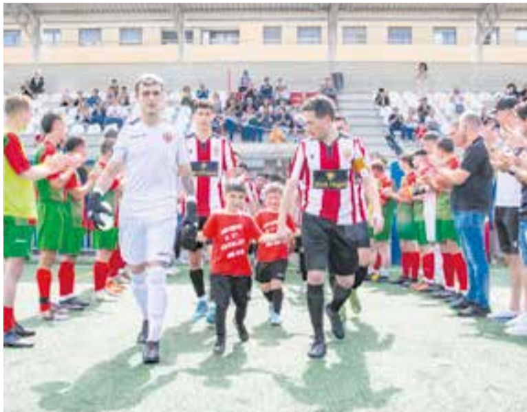
El Puig-reig va fer el passadís a la UE Castellar.

El Castellar tancarà la temporada a La Ferreria amb el Montcada