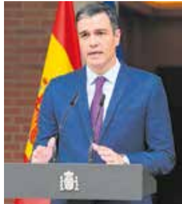
Pedro Sánchez aquest dilluns.