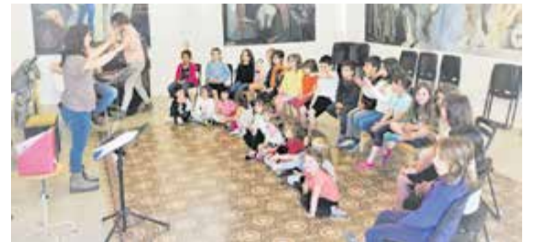
Assaig del Cor Sant Esteve per al 49è Juguem Cantant.