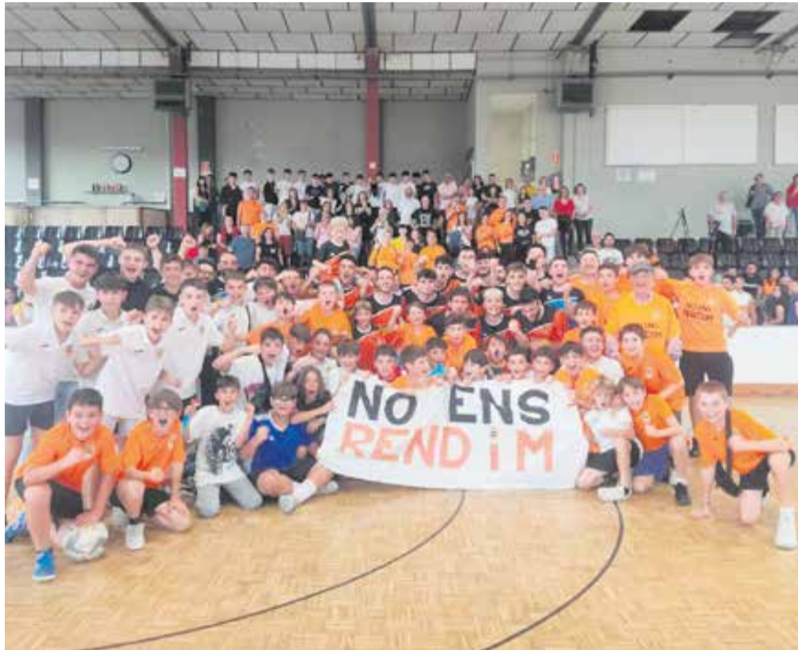
L'equip ho va celebrar amb l'afició en un Joaquim Blume que va presentar una de les millors entrades de la temporada.

“Encara no ens creiem la fita que hem aconseguit. És curiós que venint d'una temporada passada