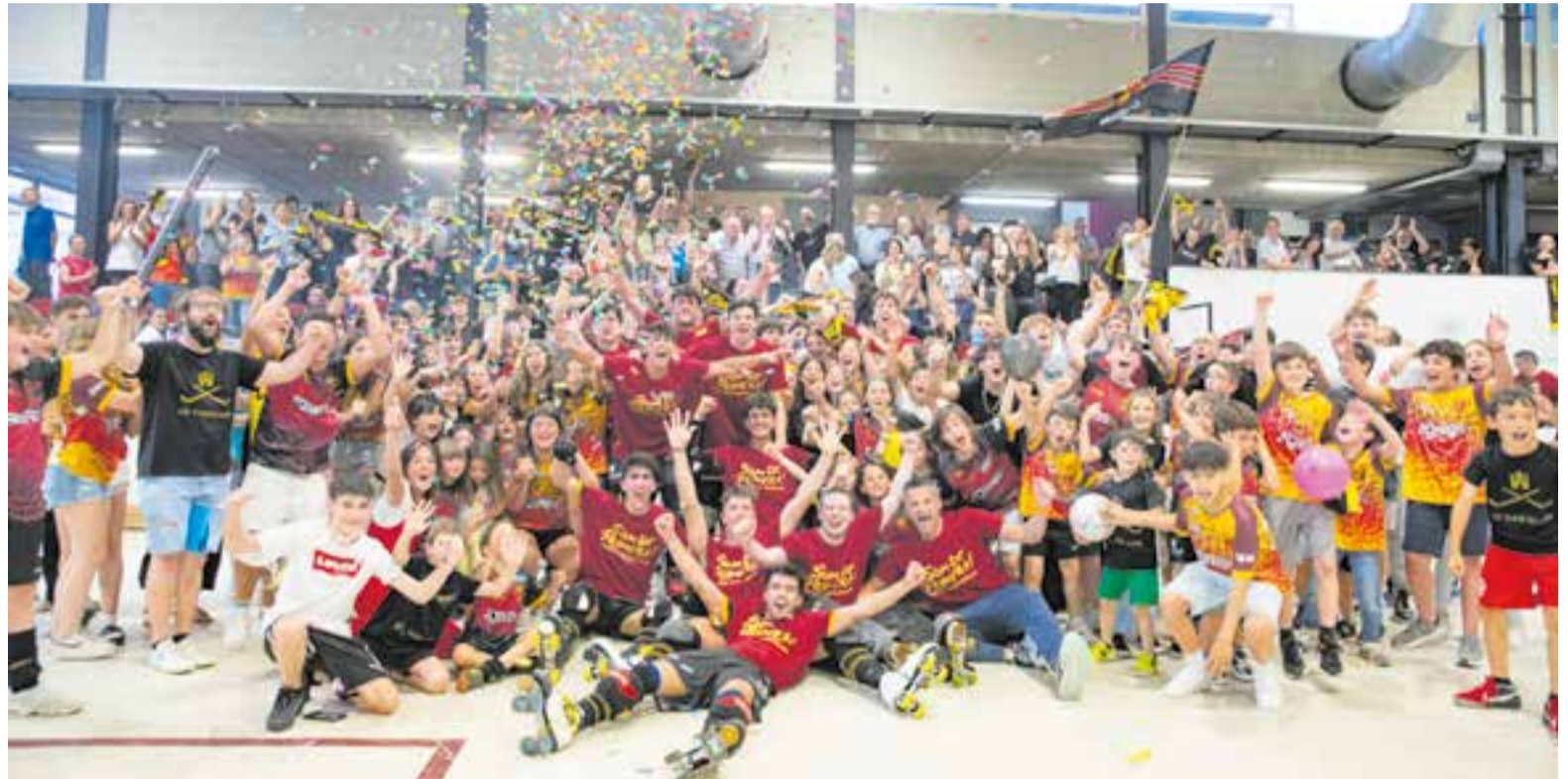
Jugadors i afició celebren l'ascens després del partit com el CP Vic al Dani Pedrosa, on va haver-hi un ple històric.

vant dels esdeveniments era patent, en contrast amb la confiança visitant, que a 3:38 va tornar a empatar l'eliminària amb el 2-4. Tot feia pensar en la pròrroga, un aspecte desfavorable per als grans, veient el desenvolupament del partit.