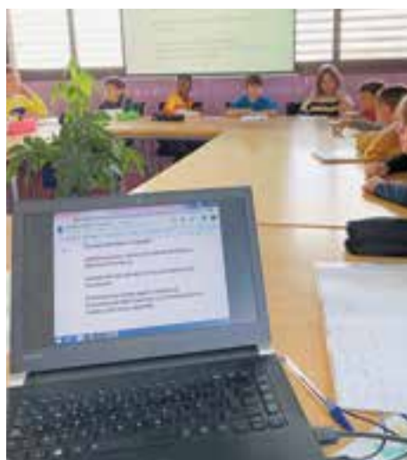
© Consell d'Alumnat reunit per definir els acords d'escola.