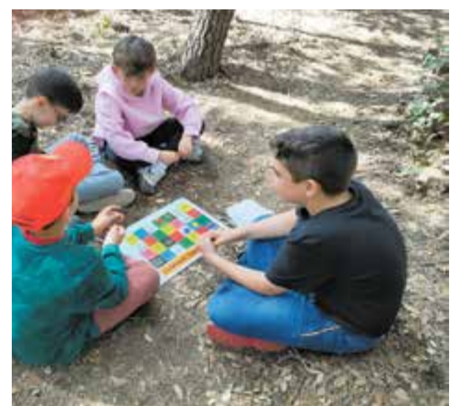
© Bany de bosc a cicle mitjà.