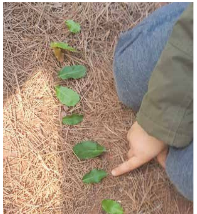
© Practiquem el comptatge d'elements naturals.