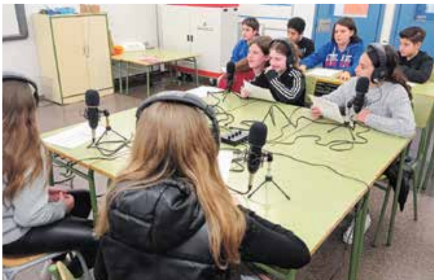
© Preparades per gravar un dels podcast.