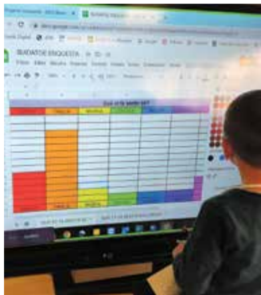
© Analitzant les enquestes a cicle inicial.