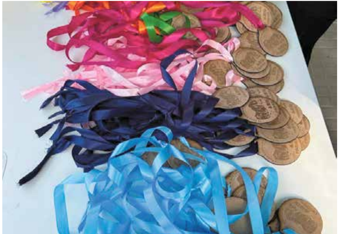
© Obsequi a la participació en la Cursa Solidària.

El final de festa va ser amenitzat pel grup de tabals del centre, els Atabalats, que van fer ballar els capgrossos i els participants encara presents. La valoració final que fem com a comunitat educativa és molt positiva a tots els nivells. Tant el procés com el producte final van resultar molt satisfactoris per a totes les participants. Esperem repetir amb els aprenentatges que ens ha comportat un projecte que es porta a terme per primera vegada amb il·lusió i moltes ganes.