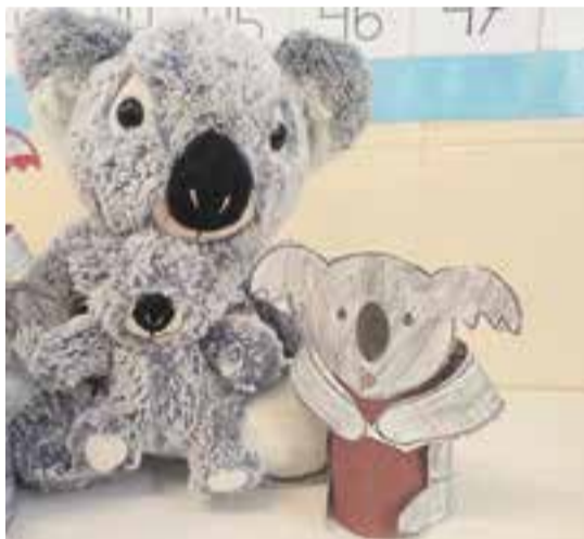
© Els coales que vendrem amb la nostra mascota: la Fulla i la Coalita.