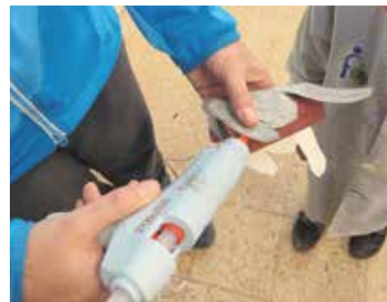
Utilitzem silicona per acabar la nostra manualitat.