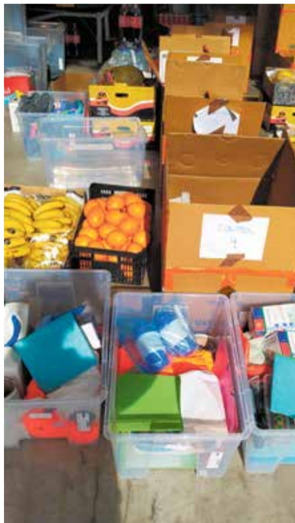
© La preparació del material és molt completa.