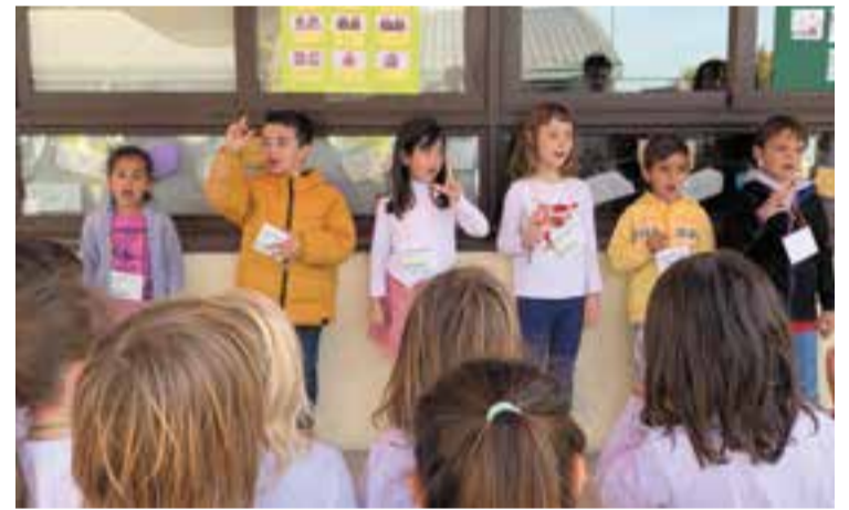
© Mostra de llengua de signes catalana (LSC).