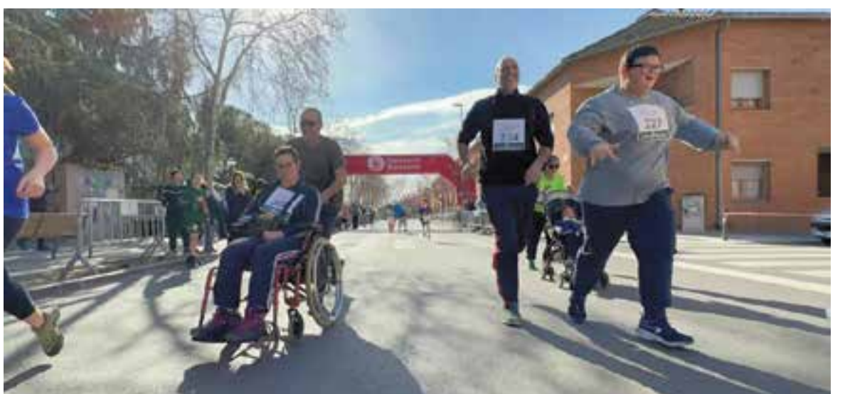
© Tret de sortida d'una de les curses, de 500 m.