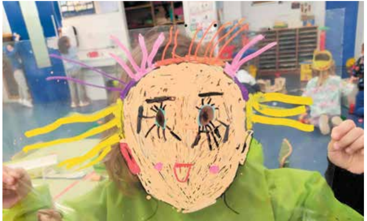
© Taller de les emocions a educació infantil.

La conclusió del resultat de les enquestes fetes als alumnes de l'escola és: La família ens fa sentir molt i molt bé!