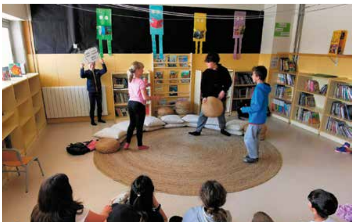
© 'Role playing' a cicle superior.