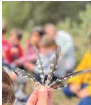
© Descubrim rastres a la natura.

Per tot això, és important que els infants puguin gaudir de la natura, passar-hi temps, estimar-se-la, perquè en un futur la sentin seva.