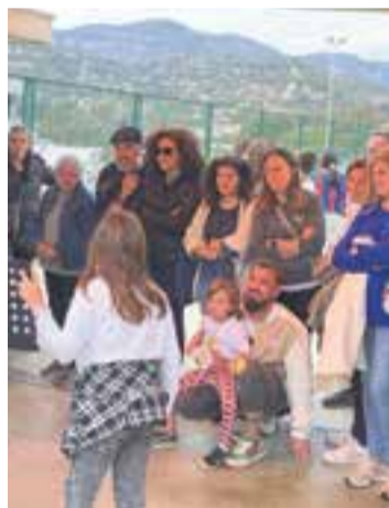
© Les famílies visiten la fira.