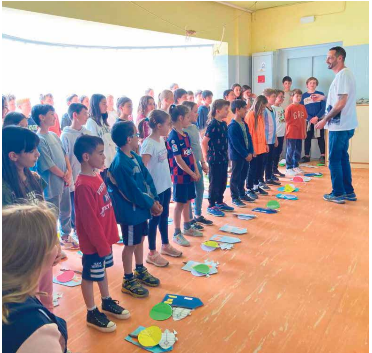
© Els i les alumnes de sisè preparats amb el material del concert.

Durant els mesos que l'escola ha pogut portar a terme aquest projecte, les diferents classes s'han repartit diverses tasques per poder crear el material que cal portar el dia de l'actuació. Els globus que apareixen en diverses cançons han estat fonamentals per treballar les matemàtiques i la geometria. D'altra banda, s'han utilitzat materials naturals que trobem al pati de l'escola per preparar els coets que ens ajuden a arribar a la lluna en una de les diverses peces. L'aprenentatge competencial, global i transversal serà l'eix i el pilar fonamental que assentarà les bases de la creativitat, l'expressivitat i l'amor per la música.