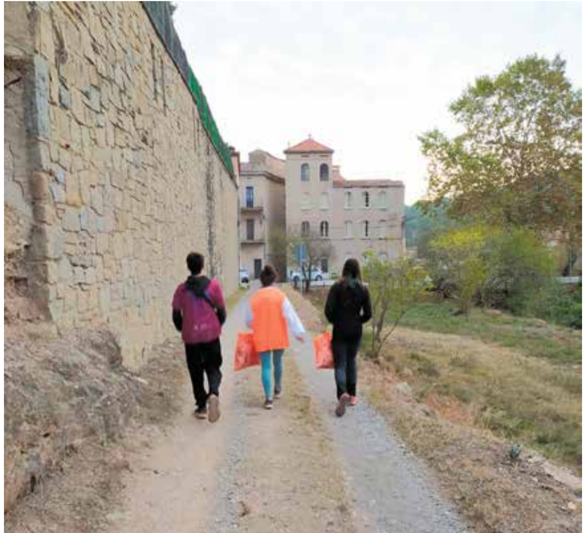
© Desfent el camí fins l'arribada a la meta.

Realment, sense l'ajuda de molta gent voluntària, no seria possible.