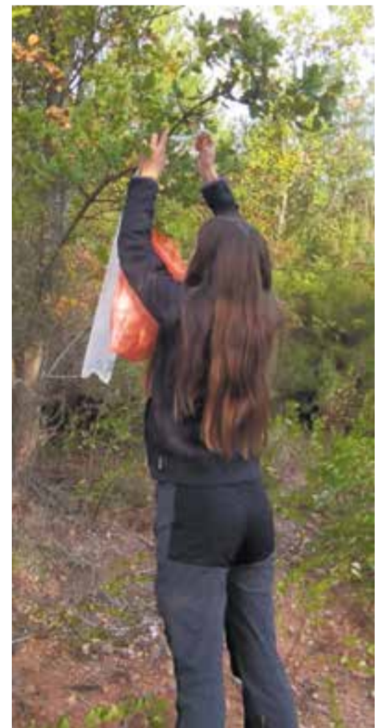
© Senyalant la ruta de la marató.