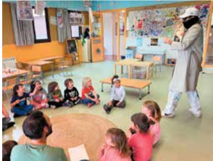
© El personatge curiós arriba a l'escola!