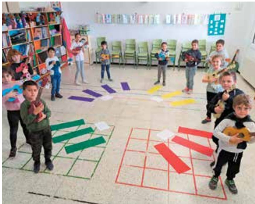
© Amb la música també es juga.