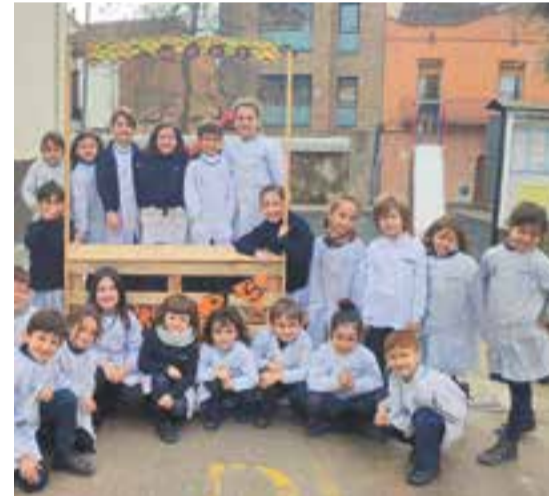
© Els nens i nenes de la classe dels Coales.