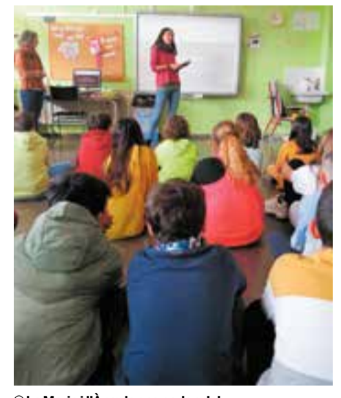
© La Maria i l'Àngels ens parlen del projecte i de l'associació IURTA.