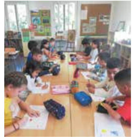
© Escrivim a la llibreta de l'escriptor.