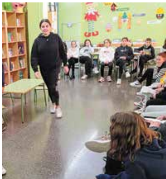
© Assaig de l'escena u de l'obra 'Desplaçades'.