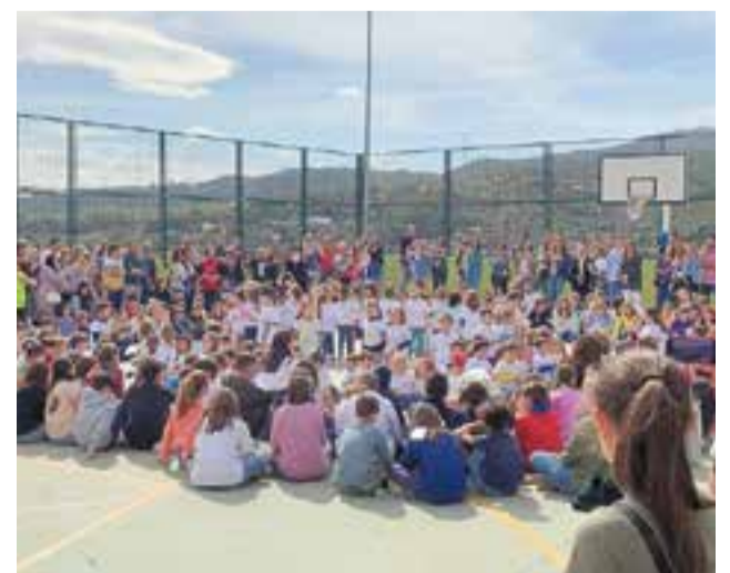
© Cloenda amb tota la comunitat educativa reunida.