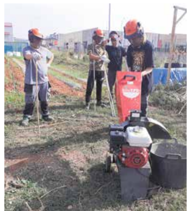
© Neteja de l'àrea de treball.