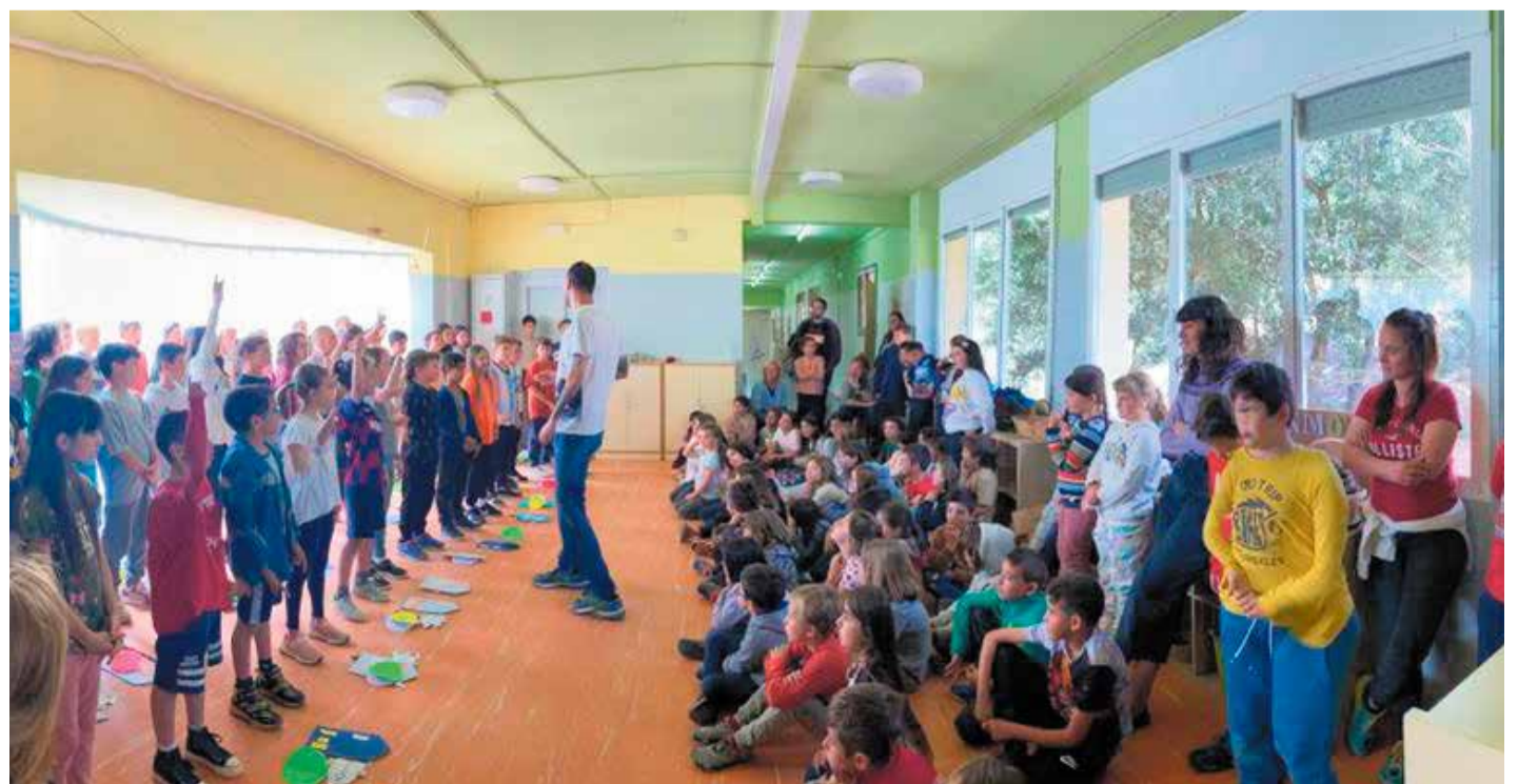
© L'escola gaudint de l'assaig general.