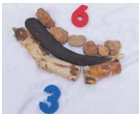
© Calculem l'estimació matemàtica.