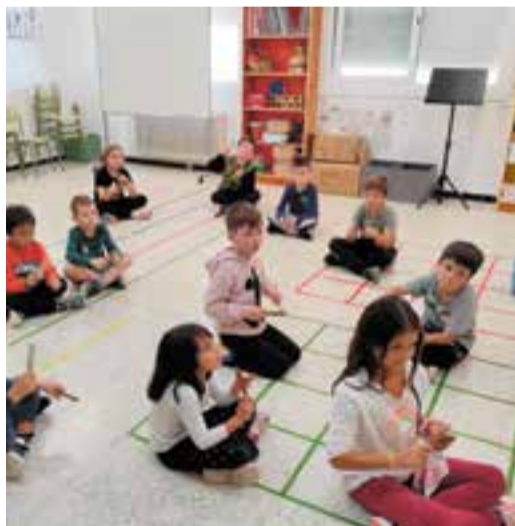
Amb la música també es juga.