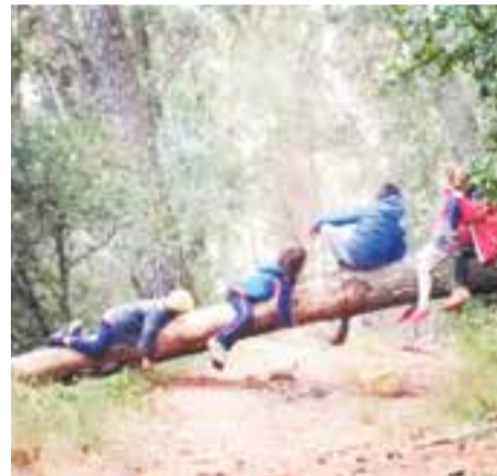
© Treballem la psicomotricitat.