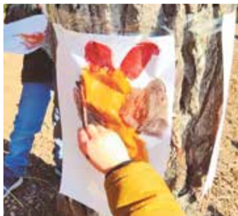
© Desenvolupem l'expressió artística.