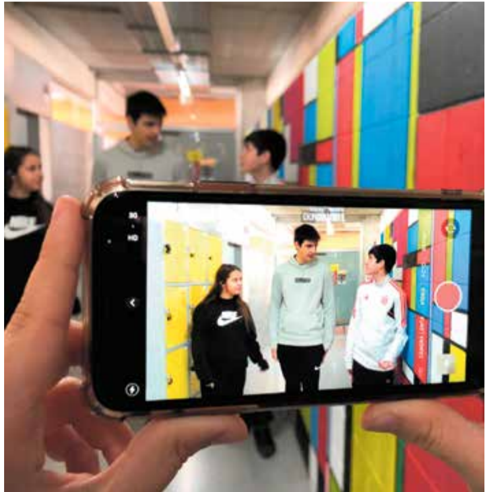
© Alumnes de 4t de l'ESO gravant el seu curtmetratge.

Pensem que és un projecte molt enriquidor per a l'alumnat i, segons el nostre punt de vista, considerem que s'hauria de continuar fent. En l'educació obligatòria actual no se'ns ensenya res o gairebé res sobre el cinema i d'aquesta iniciativa, a més de ser entretinguda, els alumnes en traiem profit i descobrim una branca artística que pot generar-nos interès i donar-nos opcions de cara al futur.