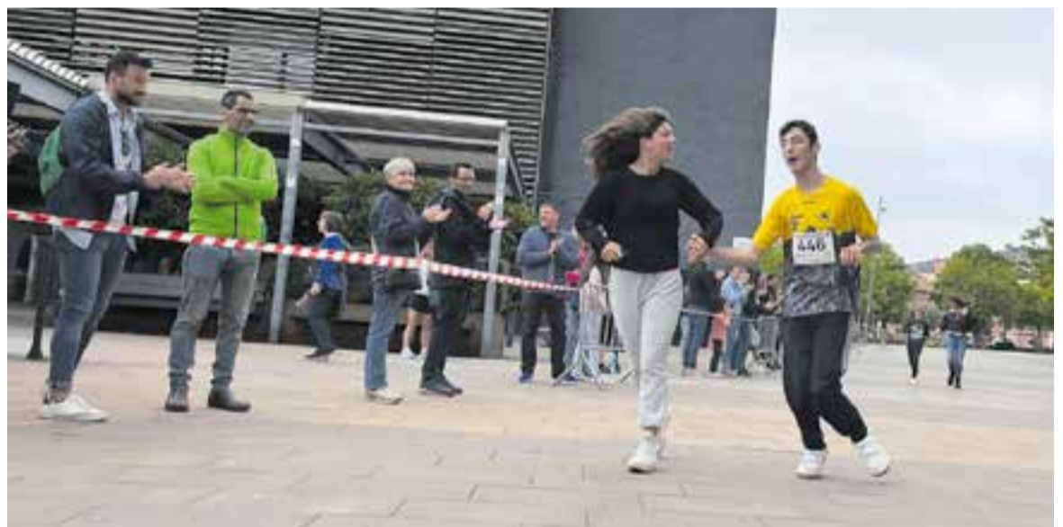
A dalt, les curses dels més petits van ser les més nombroses. A baix, la cursa inclusiva.