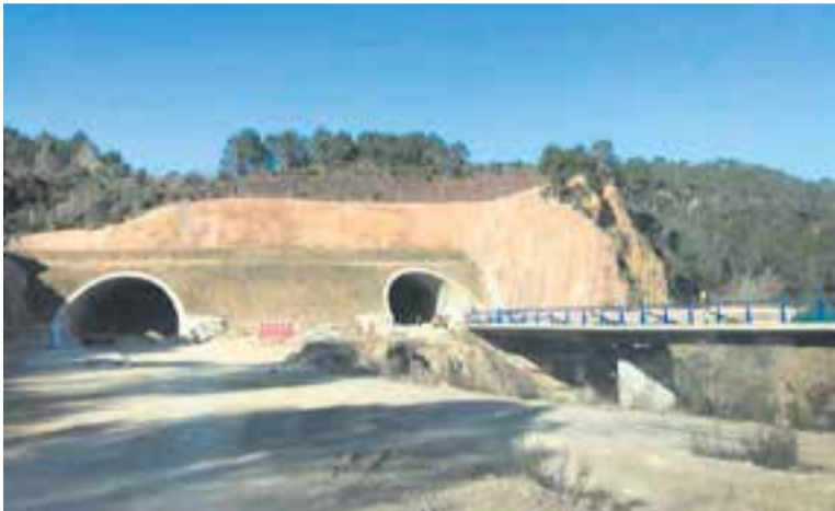
Obres de la B-40 al tram Olesa de Montserrat - Viladecavalls.

La segona reunió entre el Govern i el Ministeri de Transports deixa el projecte pendent de "serrells", segons els protagonistes de la reunió