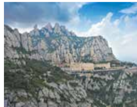
Montserrat, punt final de la travessa.

Aquest diumenge dia 7 se celebrarà la 32a edició de la Travessa Castellar-Montserrat, organitzada pel Centre Excursionista Castellar. Aquesta caminada clàssica cobreix la distància de 33 km entre la vila i el monestir, amb un desnivell de 1.400 metres.