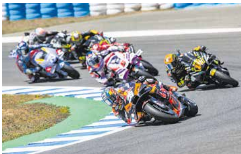
Dani Pedrosa en un moment del GP d'Espanya a Jerez.