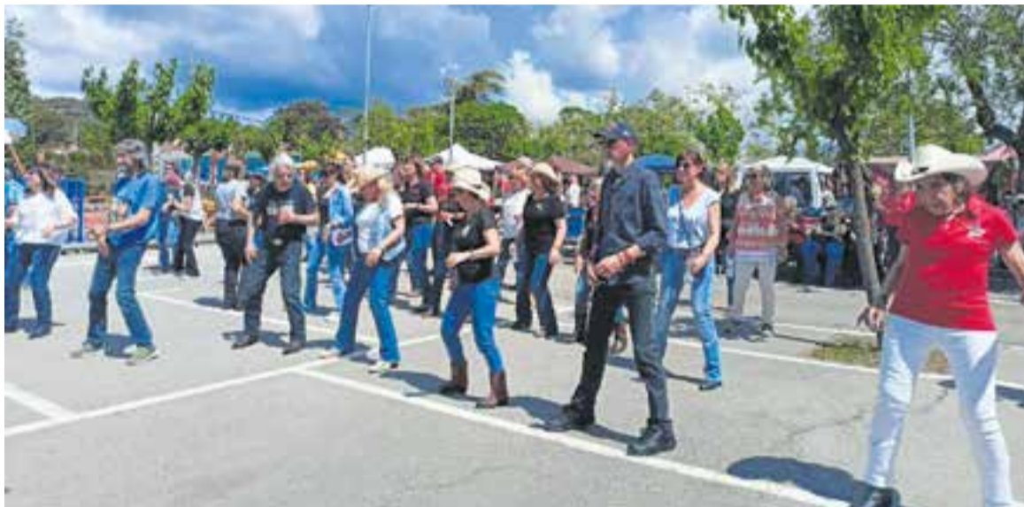
Ball country a la Festa de Primavera de Can Font i Ca n'Avellaneda, diumenge passat.

La paella popular de la celebració va sumar més de 130 comensals