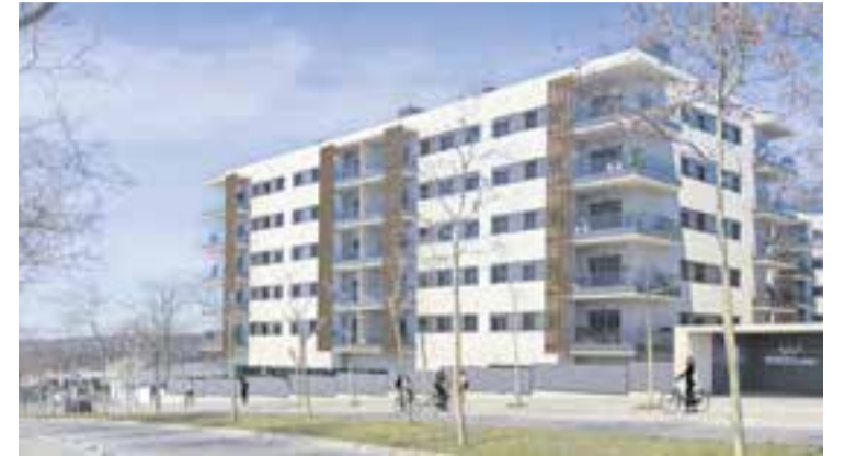
Recreació del complex residencial d'Inbisa que projecta a la Ronda Tolosa.