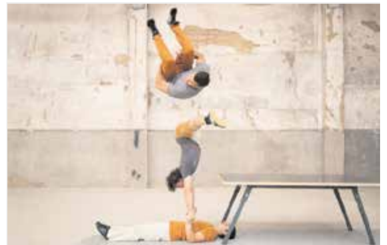
El Circ Pistolet visita Castellar amb 'Potser no hi ha final'.

El Circ Pistolet va néixer l'any 2008 a Terrassa. L'equip assaja al Tub d'Assaig d'aquesta població vallesana. +