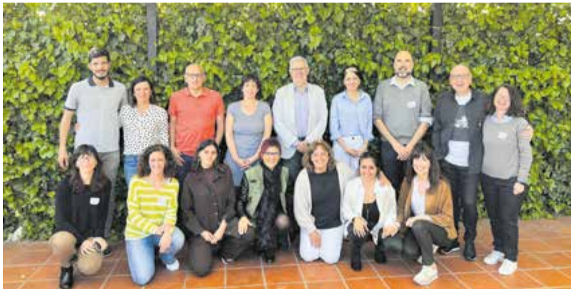
Representants dels ajuntaments promotors del grup de treball.

Castellar col·labora amb 7 ajuntaments i la Fundació Bertelsmann per oferir una orientació acadèmica i professional de qualitat