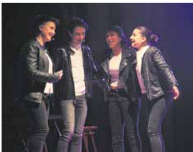
Alguns dels actors i actrius que veurem 'A-Escena'.

I el diumenge 21, les famílies també podran gaudir del Petit Embassa't, amb les propostes de Tortell Poltrona, Embauka i Lali Begood. També hi haurà disponible un espai per a jocs infantils i un espai nadó. +