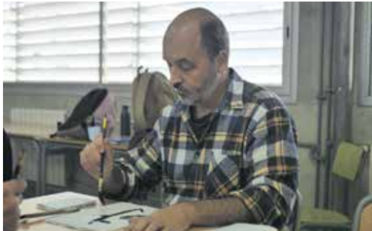
Badal, en un taller de cal·ligrafia japonesa a l'INS Puig de la Creu, abril 2023.

• Escrius el llibre de poesies 'El món és senzill', què t'hi ha empès?