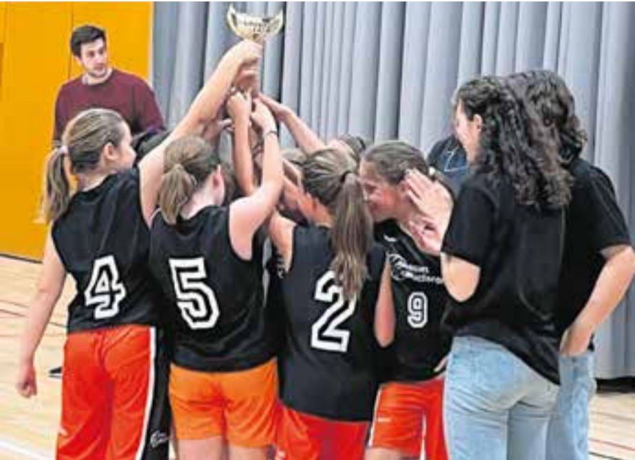
El SAFA Claror femení, un dels equips campions de la Festa del Minibàsquet del CB Castellar.