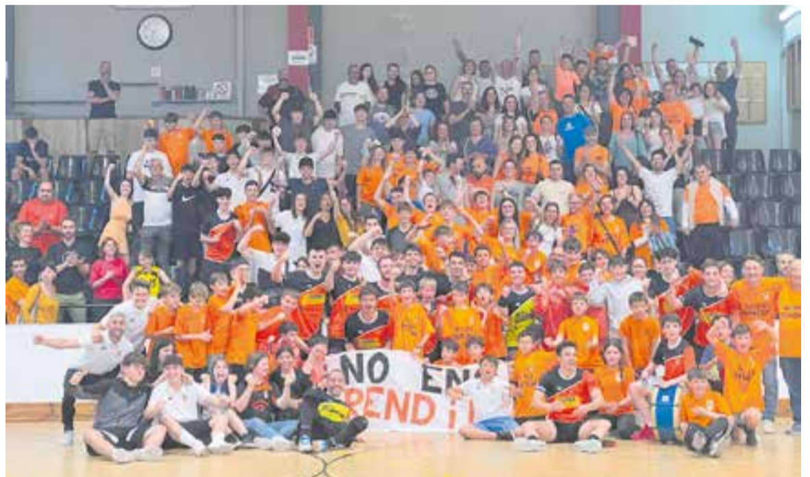
L'equip va voler celebrar la victòria contra el líder, el CFS Montsant, amb la seva incondicional afició. ||CEDIDA

Amb un calendari gairebé calcat al Parets, el Castellar està a expenses de la fallida del rival, un aspecte que es pot concretar aquesta setmana. Mentrestant, l'equip continuarà amb l'eslògan talismànic per continuar creient: no ens rendim! ➔ A. SAN ANDRÉS