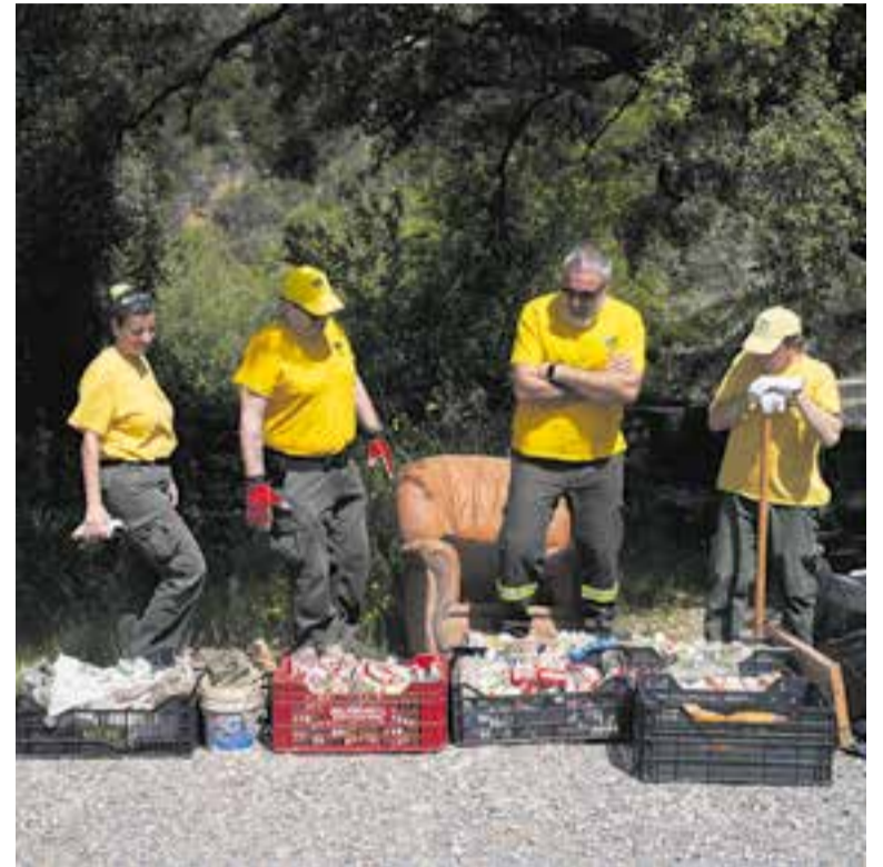
A l'edició de l'any passat es van recollir més de 1.200 quilos de deixalles.

L'activitat es durà a terme entre les 10 i les 13 hores. Per participar-hi cal ser major de 16 anys (els menors han d'anar acompanyats d'un adult) i es recomana dur roba i calçat còmode, portar aigua i protecció solar. +