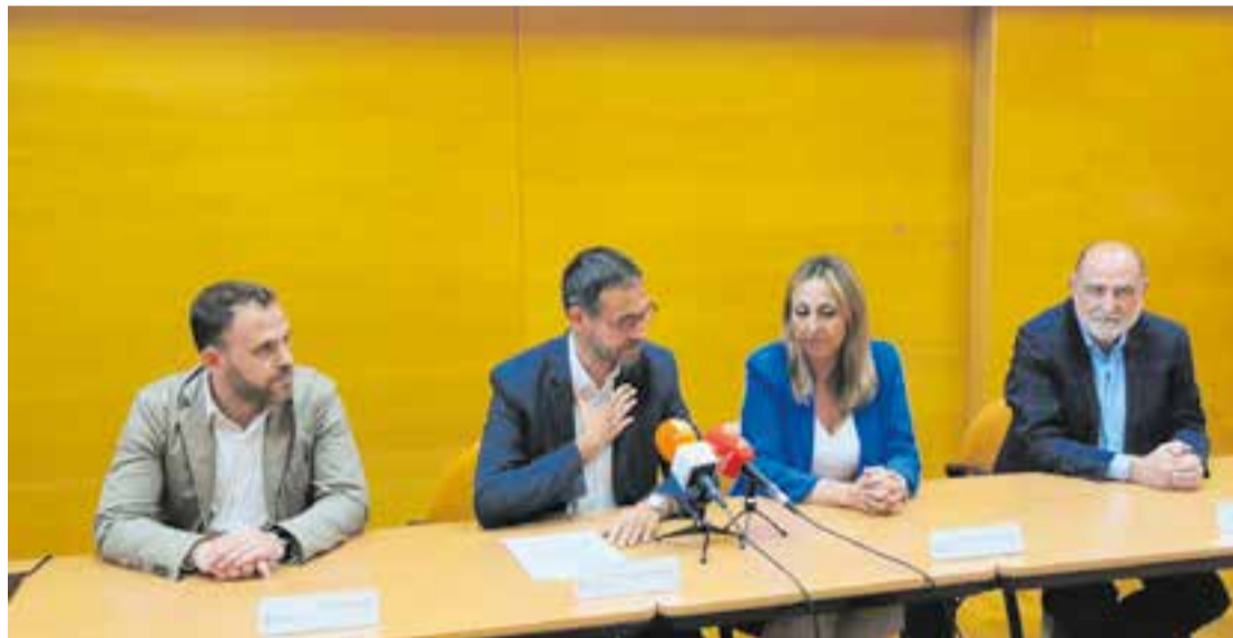
Compareixença dels alcaldes de Cerdanyola, Castellar, Badia i Barberà a la seu del Consell Comarcal aquest dijous.