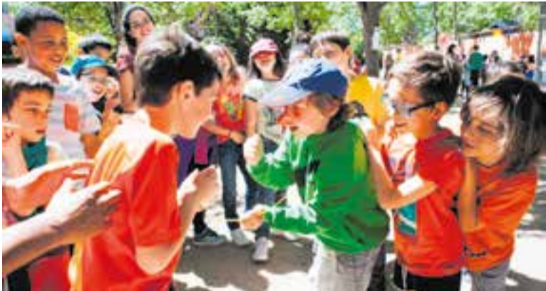
Imatge de la darrera trobada del MEV a Castellar, fa sis anys.

El Moviment d'Esplai del Vallès reunirà 254 infants a les pistes d'atletisme