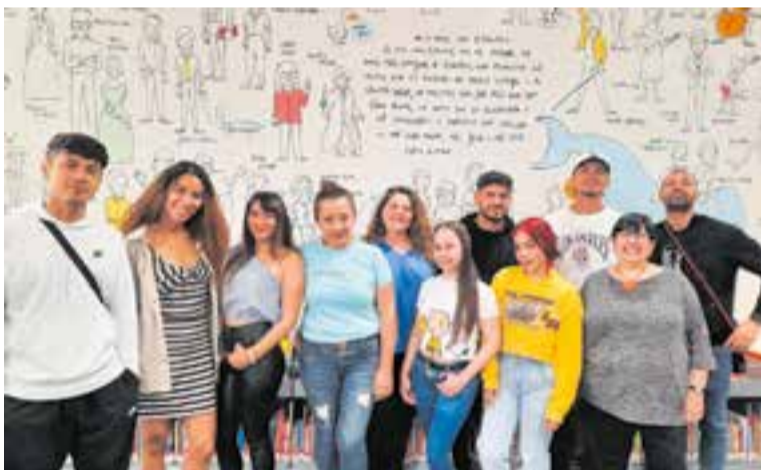
Els alumnes a la sala infantil de la Biblioteca Antoni Tort.