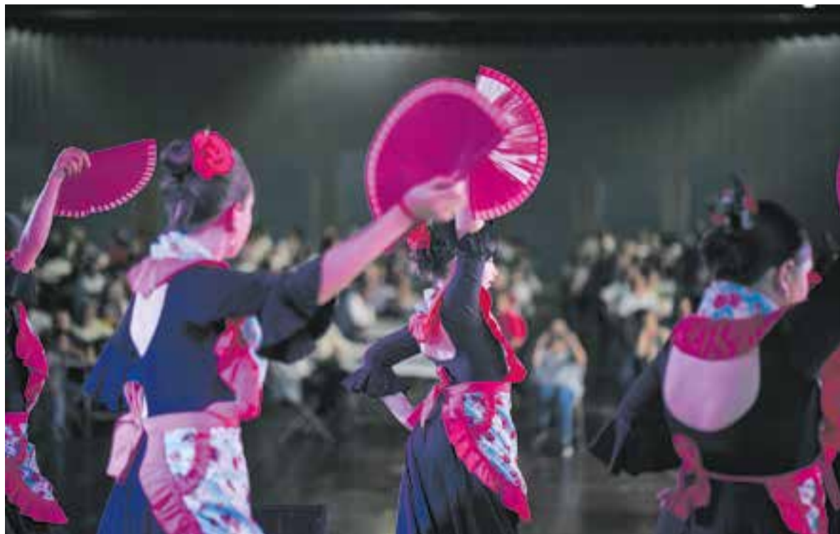
Una actuació de ball flamenc a càrrec de dansaires joves a la Feria de Abril celebrada a l'Espai Tolrà el cap de setmana passat.

El tret de sortida de la festa andalusa a Castellar del Vallès va ser divendres, amb actuacions de joves. Van oferir un concert les formacions Under the Riff, Overbooking i, d'estil urbà, Dolar, Wargon i Didu Torres. Tot i que els grups no tenen relació amb la cultura andalusa, la Feria d'Abril els va convidar perquè la cita suposa un bon aparador per actuar