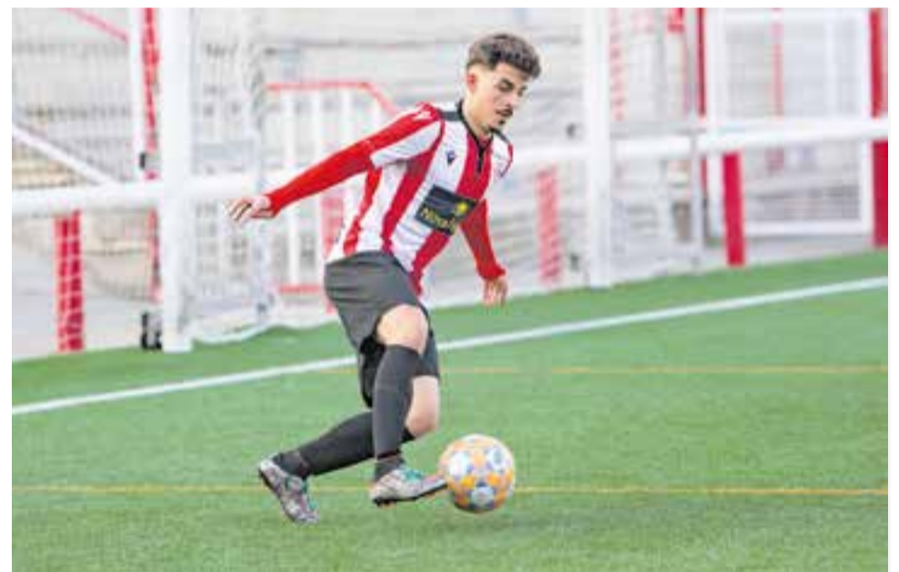
La UE Castellar està obligada a guanyar si no vol perdre opcions d'aconseguir l'ascens. || A. SAN ANDRÉS

La derrota, però, va venir acompanyada de l'empat a un del Joanenc contra el San Juan de Montcada, cosa que permet a l'equip mantenir dos punts de distància amb els de Sant Joan de Vilatorrada i arrencar la segona volta amb la missió de sumar els vuit punts per assolir l'ascens a Primera Catalana. + || A. S.A.