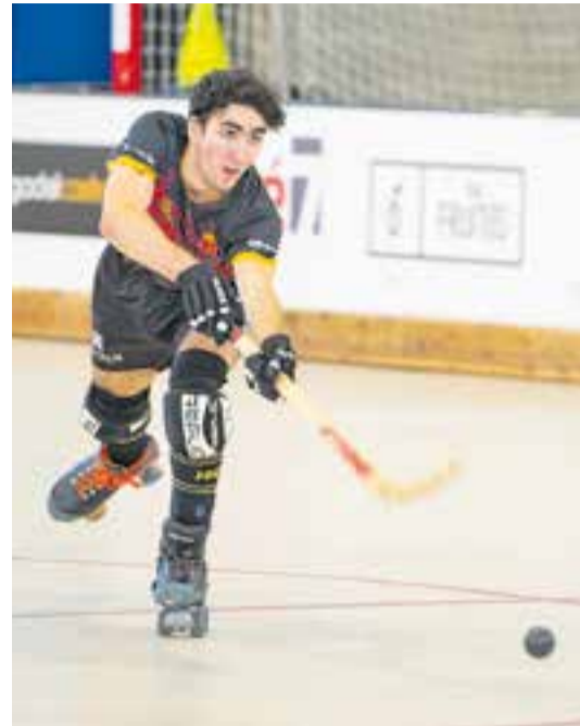
El XXX, últim escull de l'HC Castellar per l'ascens. || A.S.A.

L'HC Castellar ha conegut aquest dimecres quin serà el seu últim rival en la lluita per l'ascens de categoria. El CP Vic, equip que ha aconseguit el quart lloc en el grup 3-1 d'ascens, serà l'última pedra pel retorn a Primera Catalana de l'equip grana.