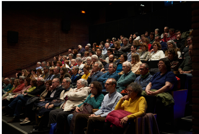
Imatges de l'edició 2024

Organització: per catorzè any consecutiu, coproducció del Club Cinema Castellar Vallès (CCCV) i l'Ajuntament.