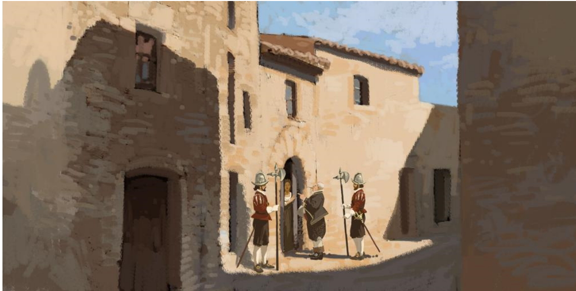
Il·lustració de Joan Mundet per al curtmetratge documental No eren bruixes