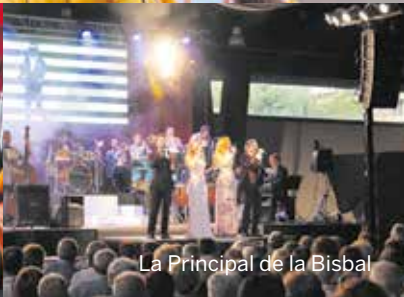
La Principal de la Bisbal