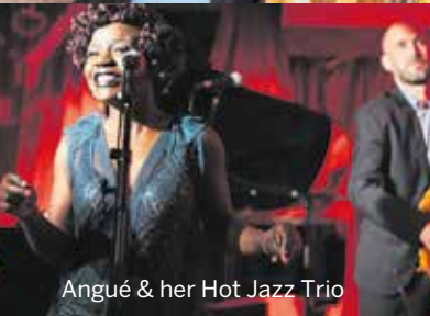
Angué & her Hot Jazz Trio