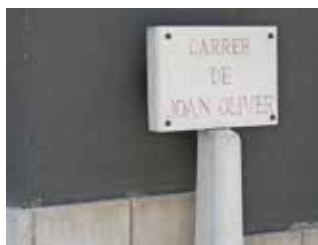
Monòlit dedicat a la memòria del poeta Pere Quart al carrer Joan Oliver.