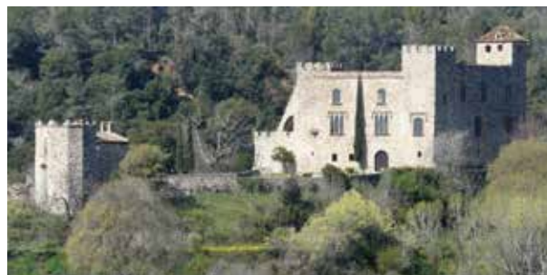
Vista del Castell de Castellar des del pati de Ca n'Oliver.