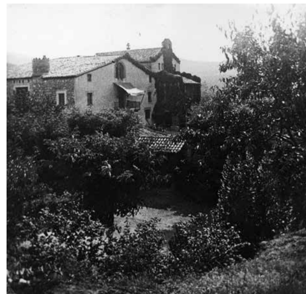
Ca n'Oliver de Castellar del Vallès.

A vegades s'oblida que Pere Quart estimava profundament el paisatge vallesà. Ho veiem en els versos de les famoses "Corrandes d'exili": "En ma terra del Vallès / tres turons fan una serra, / quatre pins un bosc espès, / cinc quarteres massa terra. / "Com el Vallès no hi ha res." ". Però, en els últims anys de la seva vida, es queixava que li havien fet malbé el seu paisatge. Parlarem d'aquest Vallès de la poesia de Pere Quart: del que fou i del que encara ens resta per conservar i apreciar.