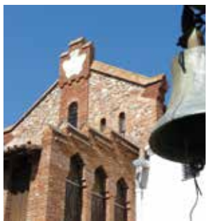
Ca n'Oliver en l'actualitat.