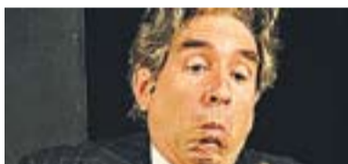
Claret Clown 2008