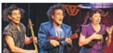
Los Excéntricos 2009