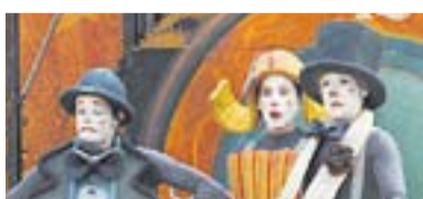
Cia. La Tal 2013