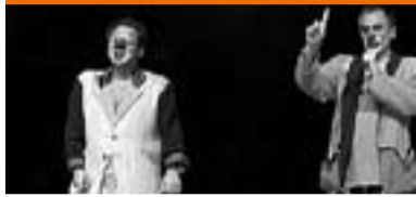
Companyia Ínfima la Puça 2005

El Sabatot Alegre és un premi honorífic anual sense dotació econòmica però amb la rellevància que dóna el fet que el premi l'atorguen els mateixos pallassos.