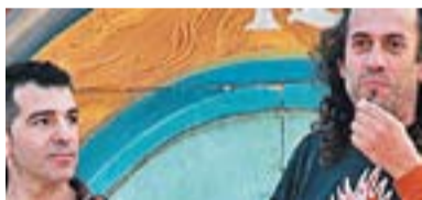
Pallassos sense Fronteres 2007