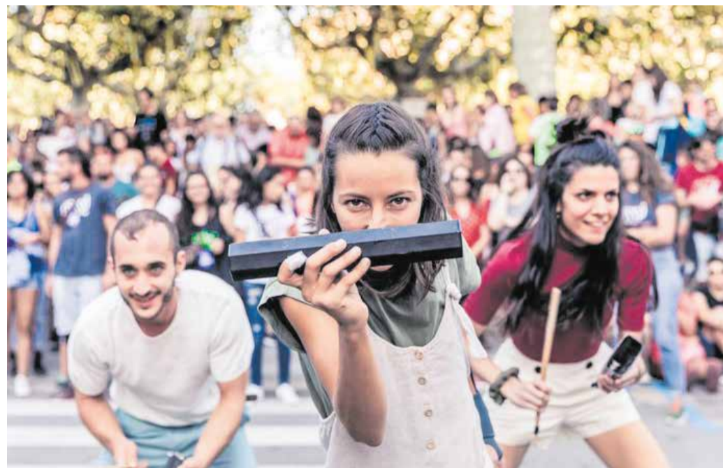
Sound de Secà.