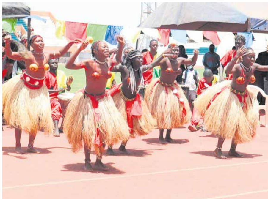
Os Netos de Bandim.

Sis músics integren aquesta banda que va néixer l'any 2020 a mig camí entre el Maresme, el Vallès i Mallorca. Un sextet que recupera la sonoritat característica dels anys 90 fusionada amb la música folk de les tradicions, la terra i el ball. L'any passat la banda va publicar el seu primer disc, Festisme , que inclou deu cançons que van de la cúmbia al vals i de la ranxera al reggae. Una combinació d'estils plens de melodies ballables i lletres quotidianes i fresques per convidar-nos a ballar. Un projecte ple d'energia i vitalitat.