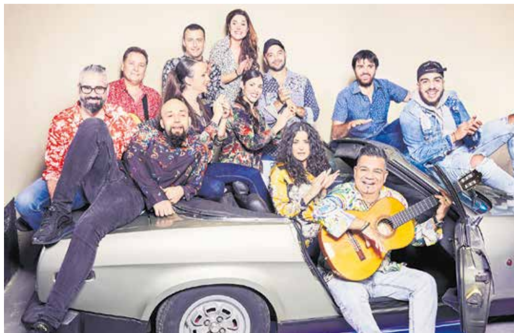
Sabor de Gràcia.